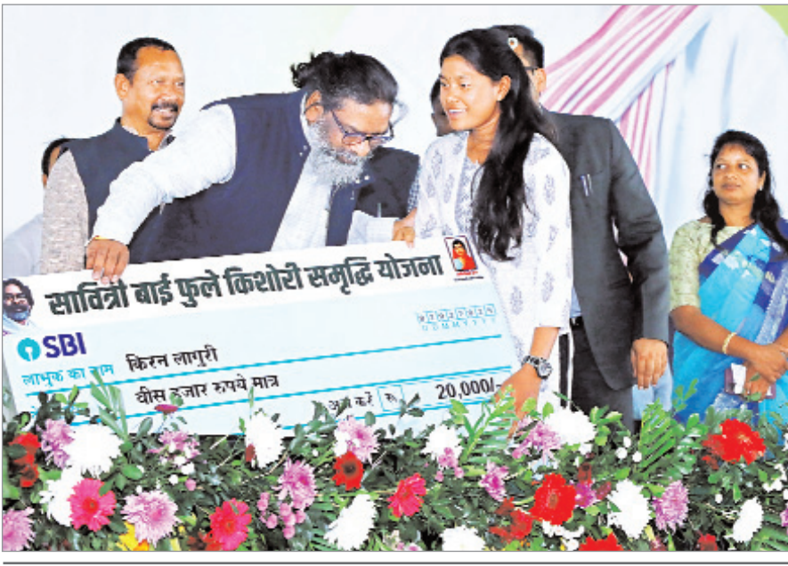
मुख्यमंत्री हेमंत सोरेन ने झारखंड विकास योजनाओं का उद्घाटन व शिलान्यास किया। इसमें 3 अरब 15 करोड़ 27 लाख 70 हजार 359 रुपए की लागत से 178 योजनाओं का शिलान्यास एवं 96 करोड़ 97 लाख 26 हजार 600 रुपए की लागत से 68 महत्वकांक्षी योजनाओं का उद्घाटन शामिल है। इसके साथ विभिन्न कल्याणकारी योजनाओं के 54,946 लाभार्थियों के बीच 3 अरब 62 करोड़ 80 लाख 99 हजार रुपए की परिसंपत्तियां बांटीं। इसमें जेएसएफपीएस के तहत 6,999 दीर्घियों को 87 करोड़ 78 लाख रुपए का बैंक क्रेडिट लिमिट तथा 6963 दीर्घियों को 85 करोड़ 86 लाख रुपए का बैंक लिंकेज प्रदान किया गया। इसके अलावा 135 जनों को नियुक्ति पत्र प्रदान किया गया।

नवीन मेल डेस्क रांची। मुख्यमंत्री हेमंत सोरेन ने रविवार को कहा कि आदिवासियों को आज एक अलग पहचान मिल रही है, जो आदिवासी समुदाय के पूर्वजों की तपस्या, त्याग और बलिदान का परिणाम है। उन्होंने कहा, हम उन शहीदों को सम्मान एवं नमन करते हैं, जिनकी बदौलत देश के विभिन्न मंचों पर अपनी आवाज बुलंद करने की हम सभी को ताकत मिली है। हमें आदिवासी होने का फخر है। हमें अपने शहीदों और आंदोलनकारियों पर गर्व है।