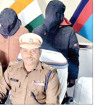
अगोड़ा थाना क्षेत्र के कुलदीप स्कूल गली में कुछ युवक नकली नोटों का कारोबार कर रहे हैं। साथ ही, किसी ग्राहक को नकली नोट सप्लाई करने वाले हैं। सूचना के बाद थाना प्रभारी के नेतृत्व में एक टीम का गठन किया गया। शेष पेज 11 पर