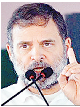
संबोधित कर रहे थे। उन्होंने कहा कि पूरे देश में जाति जनगणना करने बाद विकास उसी के अनुसार होना चाहिए। राहुल गांधी ने कहा, इससे पता चलेगा कि किसकी कितनी

लोकसभा में नेता प्रतिपक्ष और कांग्रेस सांसद राहुल गांधी ने शनिवार को कहा कि बिहार पेपर लीक का सेंटर बन गया है। उन्होंने कहा कि पूरे देश में जातिगत जनगणना होनी चाहिए। साथ ही, उन्होंने बजट में पिछड़े समुदाय के प्रतिनिधित्व पर भी सवाल उठाया। एक दिवसीय बिहार दौरे पर पहुंचे राहुल गांधी पटना के बापू सभागार में 'संविधान सुरक्षा सम्मेलन' को