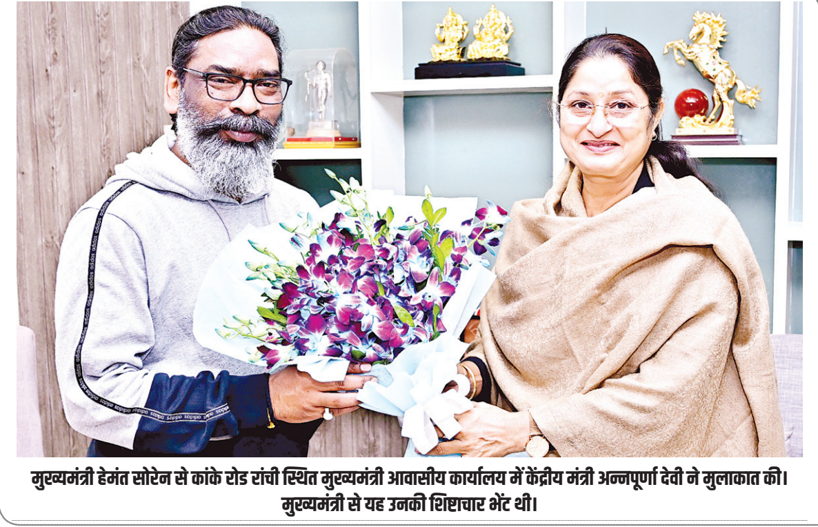
मुख्यमंत्री हेमंत सोरेन से कांके रोड रांची स्थित मुख्यमंत्री आवासीय कार्यालय में केंद्रीय मंत्री अन्नपूर्णा देवी ने मुलाकात की। मुख्यमंत्री से यह उनकी शिष्टाचार भेंट थी।