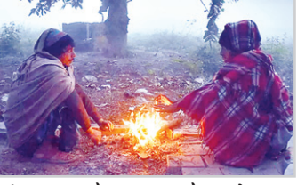
आलिंगन के शीतलत्व की उष्ण बूंदों से शायद इसको तृप्ति मिले।।

यह देह केवल एक शिथिल कवच है, पार्थिव आवरण है, छाया मात्र है जिसके भीतर प्राणों का कोई स्पंदन नहीं है। मेरे अश्रु-सरोवर की नीरजा, तुम खिलना अमले जन्म में सिर्फ मेरे लिए, मेरे दिल के आंगन में। इलजना है कि मेरी आत्मा से बस इतना इकरार करती जाना। अरे यह क्या मैं तो गिर पड़ा लड़खड़ाकर। कदम जड़ हो गए। अब और चलना असंभव सा जान पड़ता है यह बोझ लेकर। सांस फूलने लगी है। आँखें मगर खुली ही हैं किसी के इंतजार में। तभी सर से कुछ निकला शरीर से और वह निद्राल होकर एक तरफ लुढ़क गया। आत्मा ने वह दांचा वहीं छोड़ दिया। अब कुछ बचा भी तो नहीं था उसमें। जीते जी तो किसी संगम का सुख पा न सका मगर अब उसके इस पार्थिव देह को संगम के जल का आलिंगन जरूर नसीब होगा। जाओ विलीन हो जाओ और बहकर दूर किसी खेत की मिट्टी में मिल जाना। हमारा-तुम्हारा साथ यही तक था। आत्मा इतना कहकर अनंत में खो गई। पीछे छोड़ गई मिट्टी के मातृपुत्र को संगम की मिट्टी पर अचेतावस्था में।।