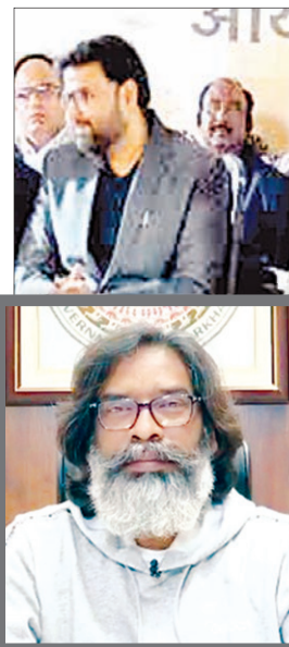
प्रधान, मुखिया और अन्य पंचायत प्रतिनिधि शामिल हुए। यह पहल