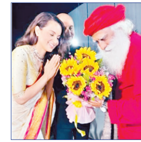
अभिनय और निर्देशन की सराहना करते हुए सद्गुरु ने कहा, लोकप्रिय भूमिकाओं को निभाना आसान नहीं होता और मुझे लगता है कि कंगना ने इस फिल्म में शानदार काम किया है। एक बहुत ही जटिल विषय को उन्होंने शानदार तरीके से प्रस्तुत

ईशा फाउंडेशन के संस्थापक और आध्यात्मिक नेता सद्गुरु हाल ही में मुंबई में आयोजित कंगना रनौत की 'इमरजेंसी' की स्पेशल स्क्रीनिंग में शामिल हुए। सद्गुरु ने कंगना के निर्देशन और अभिनय दोनों को असाधारण बताया। इसके साथ ही उन्होंने युवाओं के लिए फिल्म को खास बताया। फिल्म में कंगना रनौत के