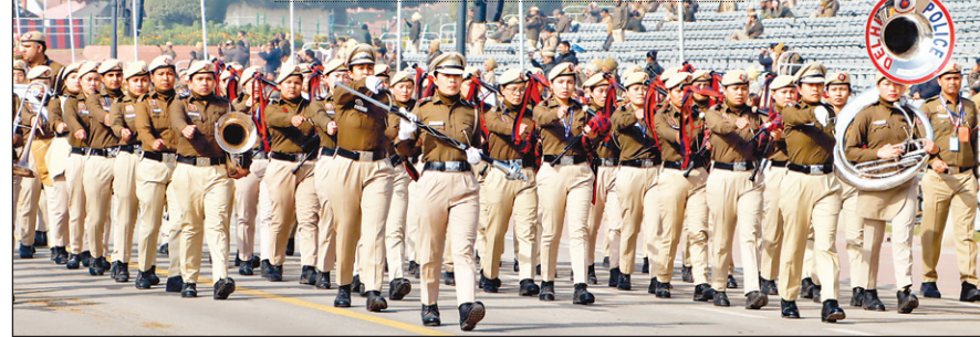
● इस वर्ष परेड में दिखेंगी देश के 15 राज्यों और केंद्र शासित प्रदेशों की झांकियां

यात्रा पर भारत आएंगे। बता दें कि वर्ष 2024 में राष्ट्रपति बनने के बाद यह उनकी भारत की पहली यात्रा होगी। गणतंत्र दिवस परेड में इस बार