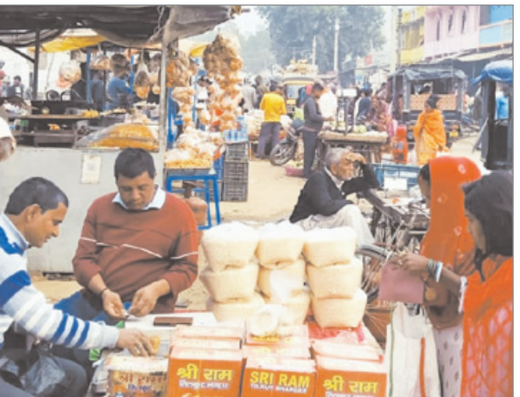
लगाई गई थी। इससे बाजार गुलजार हो उठा। इन दुकानों में अलग-अलग किस्मों व स्वाद वाले तिलकुट न्यूनतम 200 और अधिकतम 450 रुपए के भाव में उपलब्ध था, जो गया, डेहरी और सासाराम के बड़े बाजार से आयातित थे।

नवीन मेल संवाददाता मोहम्मदगंज। मकर संक्रांति पर्व पर खरीदारी को लेकर सोमवार को बाजार में चहल पहल रही। स्टेशन रोड की दैनिक बाजार में सजी दुकानों में लोग तिलकुट, चूड़ा, गुड़, मुरही, लाई, तिलवा, दूध और दही की खरीदारी में व्यस्त रहे। बाजार में तिलकुट की सौंधी महक लोगों को आकर्षित कर रही थी। बताया गया कि मकर संक्रांति पर्व के खास मौके को लेकर छोटे-बड़े कुल मिलाकर तिलकुट, चूड़ा की 20-30 दुकानों