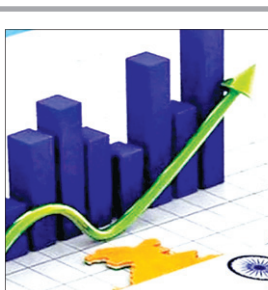
● आय वृद्धि और मध्यम वर्ग का उदय एक साथ जारी रहने की संभावना

नई दिल्ली (आईएनएस)। भारत आने वाले वर्षों में वैश्विक स्तर पर सबसे तेजी से बढ़ने वाली प्रमुख अर्थव्यवस्था के रूप में अपनी पहचान बनाए रखेगा। फ्रैंकलिन टेम्पलटन की रिपोर्ट के अनुसार, वर्ष 2025 में विकास की गति में सुधार होगा, क्योंकि सरकारी व्यय में वृद्धि हो रही है और उपभोक्ता का रुख भी सकारात्मक है। फ्रैंकलिन टेम्पलटन की रिपोर्ट के अनुसार, भारत की अर्थव्यवस्था के लिए संरचनात्मक विकास का दृष्टिकोण बहुत हद तक बरकरार है। रिपोर्ट में कहा गया है, कुल मिलाकर, हमारा मानना है कि भारत कम से कम वर्ष 2029 तक लगभग 6.5 प्रतिशत की जीडीपी वृद्धि के साथ बुनियादी सबसे तेजी से बढ़ने वाली प्रमुख अर्थव्यवस्था के रूप में अपनी स्थिति को आराम से बनाए रख सकता है। आय वृद्धि और मध्यम वर्ग का उदय एक साथ जारी रहने की संभावना है। हमें उम्मीद है कि भारत की औद्योगिक और मध्यम वर्ग की आबादी में 400 मिलियन लोगों का विस्तार होगा। विशेष रूप से, भारत के सबसे धनी