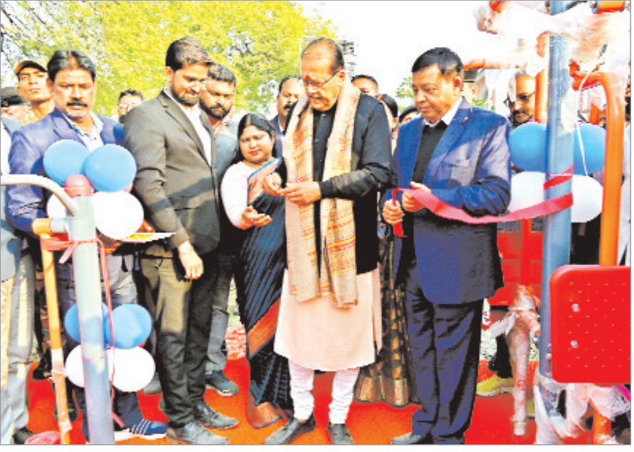
विजली समस्या के समाधान का निर्देश