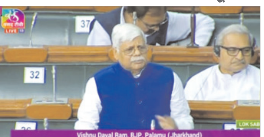
हुआ और इसे मार्च 2022 तक पूरा किया जाना था। समय पर कार्य पूरा न होने के कारण कंपनी को

नवीन मेल संवाददाता मेदिनीनगर। आज पलामू के सांसद विष्णु दयाल राम ने लोकसभा में नियम 377 के तहत गढ़वा जिले में सोन-कनहर पाइपलाइन सिंचाई परियोजना के अधूरे कार्य को पूर्ण कराने का मुद्दा उठाया। सांसद ने कहा कि केंद्र सरकार ने 2017 में 1,276 करोड़ रुपये की लागत से गढ़वा जिले की 22 हजार हेक्टेयर भूमि को सिंचित करने के लिए इस परियोजना को मंजूरी दी थी। हालांकि, राज्य सरकार की उदासीनता के कारण परियोजना का काम 2019 में एलएनटी कंपनी के माध्यम से शुरू