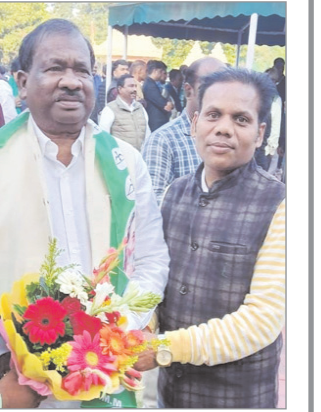
एके सिंह कॉलेज का नैक पीयर टीम ने किया जांच व सत्यापन