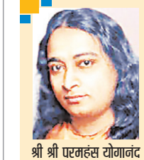
श्री श्री परमहंस योगानंद

आप सोचते होंगे कि सभ्य समाज में लोगों को पता होना चाहिए कि एकसाथ मिलजुल कर कैसे रहना है, परन्तु बहुत कम लोगों ने ही इस कला को सीखा है। एक विवाह को उच्च आदर्शों और ईश-प्रेरणा की मादकता से पोषित करना चाहिए; तब यह एक सुखी और परस्पर लाभप्रद मिलन होगा।