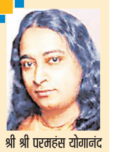
श्री श्री परमहंस योगानंद

प्रत्येक को तर्क और भावना, दोनों के आंतरिक संतुलन के लिए प्रयास करना चाहिए ताकि वह एक सम्पूर्ण व्यक्तित्व, सम्पूर्ण मनुष्य बन जाए। ईश-सम्पर्क से आप अपने भीतर इन दोनों गुणों में सामंजस्य अथवा सन्तुलन लाते हैं।