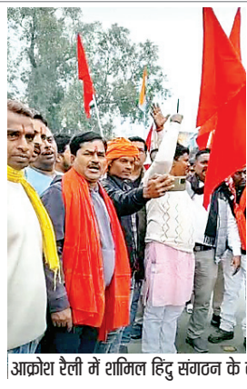
आक्रोश रैली में शामिल हिंदू संगठन के लोग