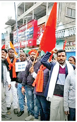
आक्रोश रैली में शामिल हिंदू संगठन के लोग

में बांग्लादेशी घुसपैठियों को भगाओ, हिंदूओं पर अत्याचार नहीं सहेंगे आदि नारे लगाये गये।