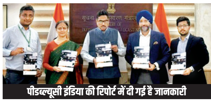
पीडब्ल्यूसी इंडिया की रिपोर्ट में दी गई है जानकारी

देश में मनोरंजन और मीडिया इंडस्ट्री का राजस्व 2028 तक 3,65,000 करोड़ रुपये तक पहुंचने का अनुमान है, जो 8.3 प्रतिशत की चक्रवृद्धि वार्षिक वृद्धि दर (सीएजीआर) है। सोमवार को जारी एक रिपोर्ट में बताया गया कि भारतीय मनोरंजन और मीडिया इंडस्ट्री का राजस्व चार वर्षों में वैश्विक दर 4.6 प्रतिशत से आगे निकल जाएगा।