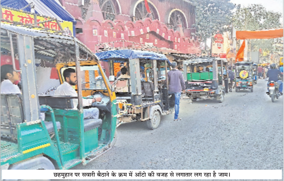
छहमुहान पर सवारी बैठाने के क्रम में ऑटो की वजह से लगातार लग रहा है जाम।

भी तालाब में फेक देते हैं, जिससे यह तेजी से सिकुड़ता जा रहा है। स्थानीय लोगों और परिवारणवितों का कहना है कि तालाब को अतिक्रमण मुक्त किया जाए और जल स्रोत को पुनर्जीवित कर इसके संरक्षण की व्यवस्था की जाए। लोगों ने पेयजल समस्या को हल करने के लिए इसे व्यवस्थित करने की मांग की है।