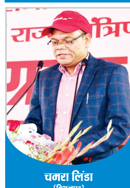
चमरा लिंडा (विश्नुपुर)