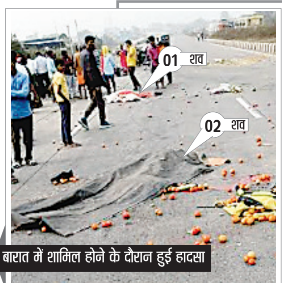
बारात में शामिल होने के दौरान हुई हादसा

टोपो विभिन्न कोषांगों के वरीय अधिकारियों सहित अन्य उपस्थित थे। साथ ही रामगढ़ महाविद्यालय रामगढ़ में पोलिंग पार्टियों के लिए विभिन्न सुविधाएं यथा भंडिकल टीम, हेल्प डेस्क सहित अन्य सुविधाएं उपलब्ध रही। ईवीएम जमा करने का कार्य पूर्ण होने के उपरांत बज्रगृह को सील किया गया। गौरतलब है की विधानसभा आम निर्वाचन 2024 के तहत 22 बड़कागांव एवं 23 रामगढ़ में हुए मतदान को लेकर मतगणना 23 नवंबर 2024 को रामगढ़ महाविद्यालय रामगढ़ में बनाए गए मतगणना केंद्र में प्रातः 8:00 बजे से शुरू होगी।