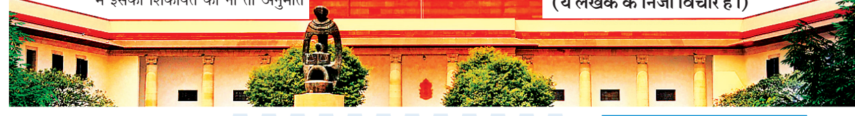
ये लेखक के निजी विचार हैं।