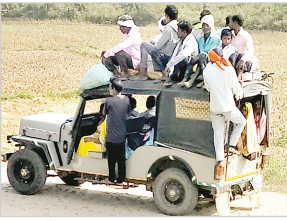
मालिकों और चालकों को कोई फर्क नहीं है। यातायात नियमों का पालन वाहन चालकों द्वारा नहीं

नवीन खेल संवाददाता रमना। दैनिक समाचार पत्रों में हर दिन सड़क दुर्घटना की खबर आते रहते हैं, इसके बावजूद भी वाहन चालकों द्वारा सड़क याता-यात नियमों का खुलेआम धज्जिया उड़ाया जा रहा। अधिक मुनाफा कमाने के चक्कर में वाहन चालक क्षमता से अधिक सवारी को भर लेते हैं, इतना ही नहीं कमाण्डर वाले गाड़ी के छज्जा पर भी सवारी को बैठा लेते हैं, इनके मन में प्रशासनिक कर्वाई का कोई डर भय नहीं है साथ ही सामान भी लाद लेते हैं गत दिन ही अलग अलग सड़क दुर्घटना में तीन लोगों की मृत्यु हो गयी, लेकिन इससे वाहन