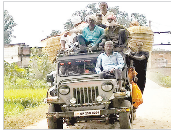
किये जाने के कारण ही सड़क दुर्घटना और सड़क जाम की समस्या इस क्षेत्र में अक्सर देखी

घायल हो गए थे। क्षमता से अधिक सवारी बैठने का काम ग्रामीण क्षेत्रों में ज्यादा है क्योंकि लोगों को कम सवारी गाड़ी की वजह से विवशता वश नहीं चाहते हुए भी गाड़ी के छज्जा पर जान जोखिम में डाल कर बैठना पड़ता है। रमना प्रखंड अंतर्गत ग्रामीण क्षेत्रों से आने वाले सवारी गाड़ियों में रविवार और बुधवार को क्षमता से अधिक सवारी ऊपर निचे लाद कर आती-जाती है, ऊपर बैठे सवारी में बड़ों के साथ नाबालिग बच्चे भी दिख जायेंगे, और सड़क की स्थिति खराब है फिर भी बेधड़क वाहन चालक ओवर लोड लेकर चलते हैं।