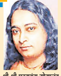
श्री श्री परमहंस योगानंद

यदि, समझ की कमी के कारण, आप किसी के साथ झगड़ा शुरू करते हैं, तो याद रखें कि आपमें से प्रत्येक उतना ही दोषी है, जितना कि दूसरा, चाहे झगड़ा किसी ने भी शुरू किया हो। मूर्ख वाद-विवाद करते हैं, बुद्धिमान विचार-विमर्श करते हैं।