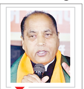
हिमाचल जैसे वादे झारखंड में भी दोहरा रही कांग्रेस पार्टी

नवीन मेल संवाददाता रांची। हिमाचल प्रदेश के पूर्व मुख्यमंत्री और नेता प्रतिपक्ष जयराम ठाकुर ने भाजपा मीडिया सेंटर, रांची में कहा कि कांग्रेस ने अपनी झूठी गारंटी देकर हिमाचल में सत्ता हासिल की। अब अपने किए गए वादों और गारंटी के विपरीत काम करना शुरू कर दिया है। ठाकुर ने कहा कि हिमाचल में कांग्रेस ने 10 गारंटी दी थी, लेकिन दो साल हो गए हैं, अभी तक कांग्रेस ने अपनी एक भी गारंटी पूरी नहीं की है। उनकी सारी गारंटी धरी की धरी रह गई। उन्होंने कहा कि कांग्रेस ने हिमाचल प्रदेश में जो वादे किए थे, अब वैसे ही वादों को झारखंड में दोहराया जा रहा है। उन्होंने कहा कि 18 से 60 साल की महिलाओं को 1500 रुपये हर महीने देने का वादा किया था, लेकिन हिमाचल प्रदेश में 2 साल बीत गए, महिलाओं-बहनों से जो वादा किया था, उनको 1500 सौ रुपये हर महीने नहीं मिले।