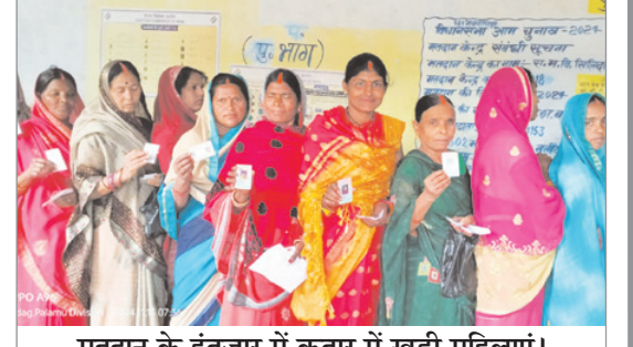
मतदान के इंतजार में कतार में खड़ी महिलाएं।