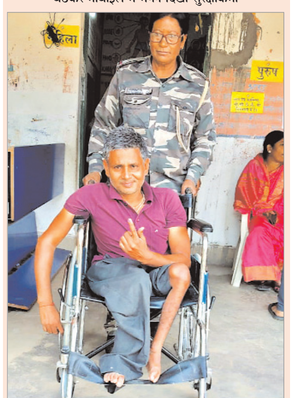
जोड़ ग्राम के मतदान केंद्र पर महिला पुलिस पदाधिकारी ने विकलांग मतदाता को व्हीलचेयर से ले जाते