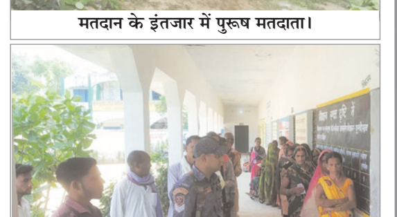
स्कूल के बाहर अपनी बारी का इंतजार करते मतदाता।