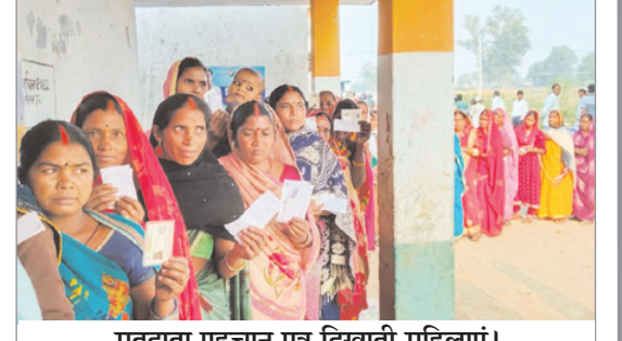
मतदाता पहचान पत्र दिखाती महिलाएं।