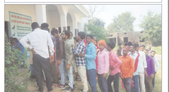
मतदान के इंतजार में पुरुष मतदाता।