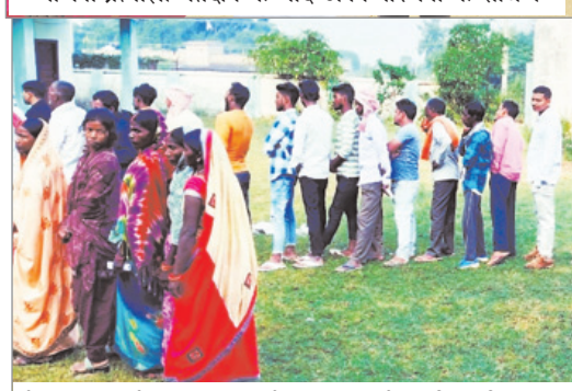
मोहम्मदगंज के विभिन्न बूथों पर सुबह से लगी लंबी कतार।