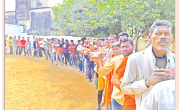
ग्रामीण मतदाता में दिखा भारी उत्साह