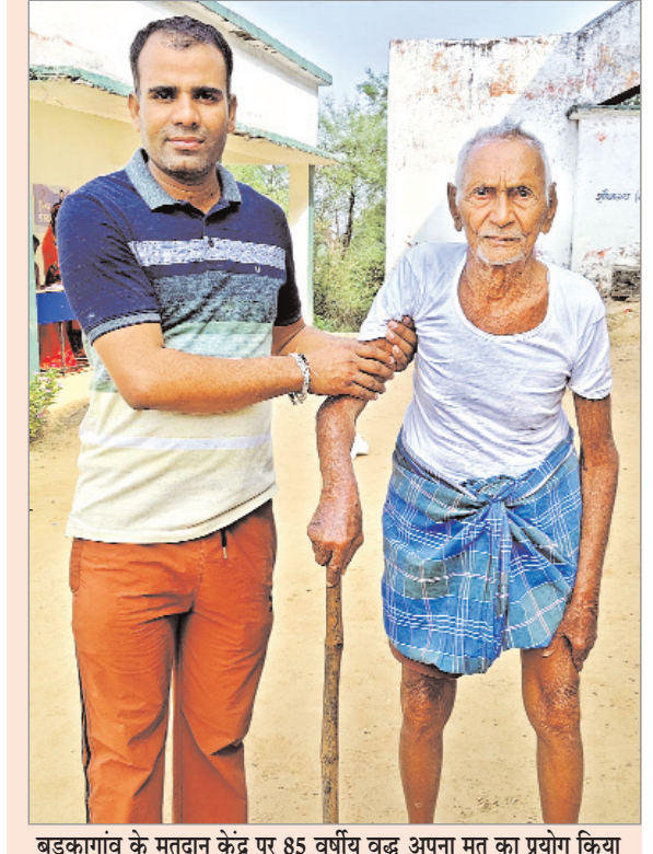
बड़कागांव के मतदान केंद्र पर 85 वर्षीय वृद्ध अपना मत का प्रयोग किया