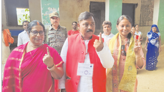
भाजाप प्रत्याशी मतदान के बाद अपने परिजनों के साथ।