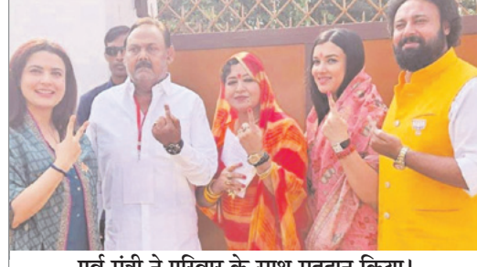
पूर्व मंत्री ने परिवार के साथ मतदान किया।

नवीन मेल के कैमरे ने देखा विधानसभा चुनाव की झलकियां