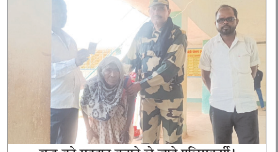
वृद्ध को मतदान कराने ले जाते पुलिसकर्मी।