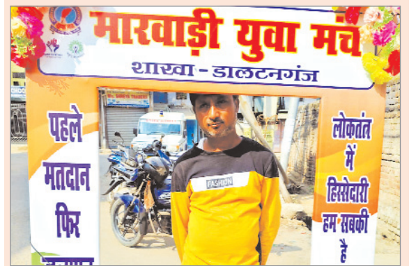
कनी राम चौक पर सेल्फी के लिए लगाया गया होर्डिंग रहा मुख्य आकर्षण का केंद्र