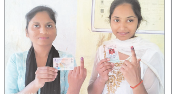
पहली बार मतदान करने के बाद निशान दिखाती मतदाता।