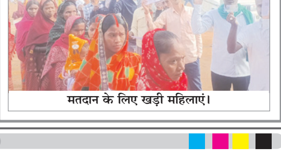
मतदान के लिए खड़ी महिलाएं।