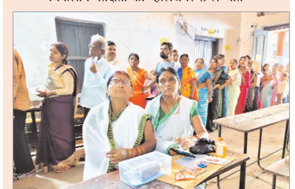
गणेश लाल अग्रवाल विद्यालय में मतदाताओं की सुविधा के लिए मेडिकल किट तथा पानी की व्यवस्था की गई थी