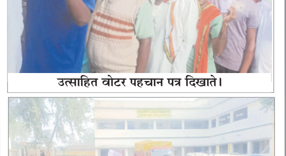
मतदान के लिए खड़ी महिलाएं।