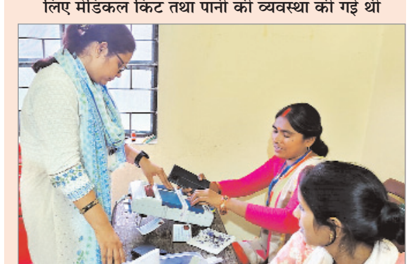
वोटिंग मशीन को मतदान पूर्ण होने के बाद बंद करते मतदानकर्मी