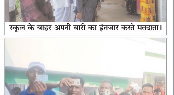
उत्साहित वोटर पहचान पत्र दिखाते।