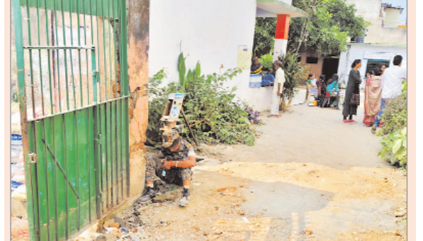
बेलवाटिका स्थित मतदान केंद्र पर मेन गेट के पास नीचे बैठकर मोबाइल में मगन दिखी सुरक्षाकर्मी