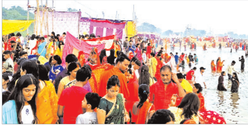
नगर निगम ने घाटों पर विशेष साफ-सफाई अभियान चलाया था, जिससे श्रद्धालुओं को किसी प्रकार की असुविधा

अर्घ्य देने के बाद व्रतियों और श्रद्धालुओं ने खीर, ठेकुआ और अन्य प्रसाद का वितरण किया। प्रसाद को खास तौर पर घर में तैयार किया जाता है, जिसमें पूरी पवित्रता का ध्यान रखा जाता है। खीर, ठेकुआ और फल के साथ ही गन्ना और अन्य मौसमी फलों का भी प्रयोग किया जाता है, जो इस पर्व की सांस्कृतिक महत्ता को और भी बढ़ा देते हैं। पूजा के दौरान स्थानीय प्रशासन ने भी खास इंतजाम किए थे। मेदिनीनगर के सभी घाटों पर सुरक्षा बलों की तैनाती की गई थी, ताकि लोग बिना किसी व्यवधान के पूजा कर सकें। साफ-सफाई के साथ ही चिकित्सा सुविधाएँ भी उपलब्ध कराई गई थीं, ताकि किसी भी आपातकालीन स्थिति से निपटा जा सके। मेदिनीनगर