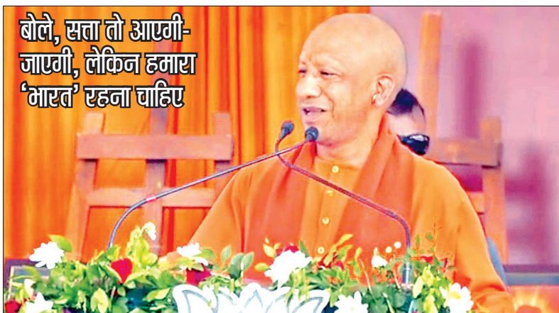
बोले, सता तो आएगी-जाएगी, लेकिन हमारा 'भारत' रहना चाहिए

उत्तर प्रदेश के मुख्यमंत्री योगी आदित्यनाथ ने बुधवार को महाराष्ट्र के वाराणसी में एक चुनावी रैली को संबोधित किया। इस दौरान सीएम योगी ने कांग्रेस और महाविकास अघाड़ी (एमवीए) पर जमकर निशाना साधा। सीएम योगी ने चुनावी रैली को संबोधित करते हुए कहा कि वाराणसी विधानसभा क्षेत्र में उमड़ा यह अपार जन सिंधु महाराष्ट्र में भाजपा की विजय गाथा लिखने जा रहा है। उन्होंने कहा कि छत्रपति शिवाजी महाराज ने जिस दुष्ट अफजल को मार गिराया था, उसके नाम पर औरंगाबाद का नाम होना और इसे याद करना। इसको हटना ही चाहिए था, इसे संभाजीनगर के रूप में पहचान मिलनी ही थी। छत्रपति शिवाजी महाराज का संघर्ष ही या संभाजी महाराज का, हमें नई प्रेरणा देता है। छत्रपति शिवाजी महाराज हम सबको एकजुट करके लेकर गए थे। हर भारतवासी को अपने साथ जोड़े थे। अपनी सेना का हिस्सा बनाए थे। सीएम योगी ने आगे कहा कि बंटिए मत! क्योंकि जब भी बंटे थे तो कटे थे। एक हैं तो नेक हैं, एक हैं तो सेफ हैं। उन्होंने कहा कि महाराष्ट्र चुनाव में दो महा गठबंधन चुनाव लड़ रहे हैं। एक तरफ महायुति