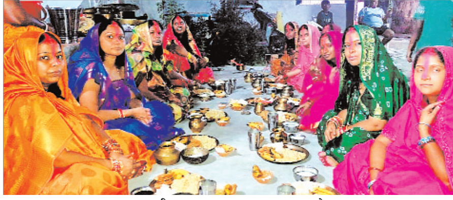
छठ ब्रती खरना पूजा कर प्रसाद ग्रहण करते।