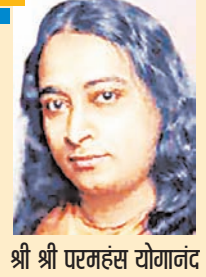
श्री श्री परमहंस योगानंद

हमारी मानवीय बुद्धि प्रभु की सृजनात्मक बुद्धि का प्रतिबिम्ब है, जिसके द्वारा सब कुछ सम्भव है, और यदि हम उस वेतना में नहीं रहते, तो हम मनोदशाओं का पुलिन्दा बन जाते हैं। रचनात्मक रूप में सोचने से हम उन मनोदशाओं को नष्ट कर देते हैं।