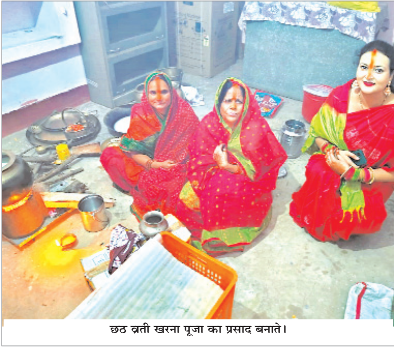
छठ व्रती खरना पूजा का प्रसाद बनाते।

नवीन मेल संवाददाता मेदिनीनगर। शहर में इस वर्ष लोक आस्था का महापर्व छठ बड़ी घुमधाम और श्रद्धा के साथ मनाया गया। श्रद्धालुओं का हजूम कोयल नदी और अमानत नदी के तट पर उमड़ पड़ा, जहाँ हजारों की संख्या में लोगों ने एकत्र होकर सूर्य भगवान की आराधना की। छठ पर्व का महत्त्व इस बात में है कि इसे एक पवित्रता और प्रकृति से गहरे जुड़ाव का पर्व माना जाता है, जो जीवन में सादगी, संयम और आध्यात्मिक ऊर्जा लाता है। छठ पूजा की तैयारियाँ कई दिनों पहले से ही शुरू हो जाती हैं। इस पर्व की विशेषता है कि इसमें उपासना के लिए कोई आडंबर नहीं बल्कि सूर्य देव और छठी मैया की उपासना पूरी निष्ठा और समर्पण के साथ की जाती है। व्रती महिलाएँ और पुरुष, पूरे विधि-विधान से 36 घंटे का निर्जला उपवास रखते हैं और इस दौरान सूर्य को अर्घ्य देकर अपने परिवार की सुख-समृद्धि और संतान की खुशहाली की कामना करते हैं। बुधवार शाम को पहले अर्घ्य का आयोजन हुआ, जिसमें कोयल नदी और अमानत नदी तट पर हजारों श्रद्धालुओं ने सूर्यास्त के समय ढुबते सूर्य को अर्घ्य अर्पित किया। पूजा के लिए व्रती महिलाएँ और पुरुष सिर पर प्रसाद के डाले लेकर नदी तटों की ओर पहुंचे। घाटों पर बने भव्य पंडाल, सजावट और दीपों की झिलमिलाहट से पूरे वातावरण में एक पवित्रता और दिव्यता का संचार हुआ। जैसे ही सूर्यास्त का समय निकट आया, लोगों ने नदी में खड़े होकर सूर्य देव को अर्घ्य दिया और छठी मैया की आराधना की।