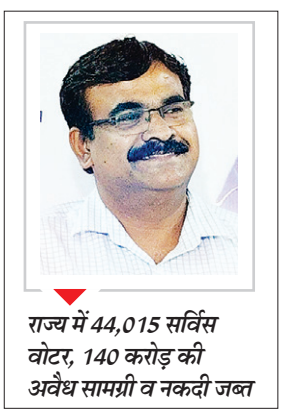
राज्य में 44,015 सर्विस वोट, 140 करोड़ की अवैध सामग्री व नकदी जब्त