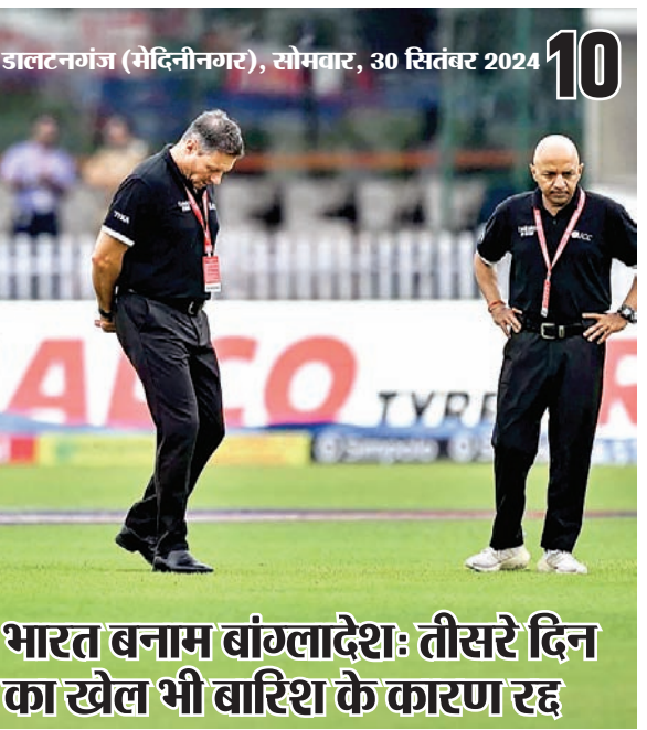
भारत बनाम बांग्लादेश: तीसरे दिन का खेल भी बारिश के कारण रुक

जयसूर्या ने 18 ओवर में दो 22 रन देकर 6 बल्लेबाजों को पवेलियन भेजा। प्रभाथ के अलावा निशान पेडिरिस ने तीन और असिथा फर्नांडो ने एक विकेट अपने नाम किया। न्यूजीलैंड की पहली पारी 88 रन पर ढेर होने के बाद श्रीलंका ने उसे फॉलोऑन दिया। दूसरी पारी में कीवी टीम के बल्लेबाजों ने कुछ संघर्ष दिखाया लेकिन वह टीम को बड़ी हार से नहीं बचा पाए। टीम दूसरी पारी में 360 रनों पर ढेर हो गई। दूसरी पारी में न्यूजीलैंड के लिए ग्लेन फिलिप्स ने 78 रन, मिचेल सैंटरन 67 रन, डेवोन कॉनवे 61 रन, कप्तान टॉम ब्लंडल ने 60 रन, केन विलियमसन ने 46 रन बनाए। दूसरी पारी में श्रीलंका को आसिथा फर्नांडिस ने 6 विकेट, प्रभाथ जयसूर्या ने 3 विकेट, धनंजय डी सिल्वे ने एक विकेट लिया।