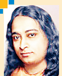
श्री श्री परमहंस योगानंद

हम वही हैं जो हम सोचते हैं कि हम हैं। हमारे विचारों की अभ्यस्त प्रवृत्ति हमारी प्रतिभाओं और योग्यताओं तथा हमारे व्यक्तित्व को निर्धारित करती है। इस प्रकार, कुछ लोग सोचते हैं कि वे लेखक या कलाकार, परिश्रमी या आलसी हैं, इत्यादि। यदि आप अपने वर्तमान में जो सोचते हैं कि आप हैं, उस व्यक्तित्व से भिन्न बनना चाहते हैं तो क्या करें? आप तर्क दे सकते हैं कि दूसरे लोग उस विशेष प्रतिभा के साथ जन्मे हैं जिसकी आपमें कमी है परन्तु आप उसे प्राप्त करना चाहते हैं। यह सत्य है। परन्तु उनको उस योग्यता की आदत