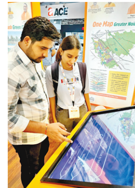
आयोजन किया जा रहा है। यह 25 सितंबर से शुरू हुआ है और 29 सितंबर तक चलेंगा। इसमें देश-विदेश के प्रतिभागी हिस्सा ले रहे हैं। यहां प्रदेश के लगभग हर जिले के प्रमुख उत्पाद भी प्रदर्शित हैं। यहां पर 'एक जिला एक उत्पाद'

ग्रेटर नोएडा। ग्रेटर नोएडा में निवेश के लिए निवेशक कितना आतुर हैं, इसकी झलक 'उत्तर प्रदेश इंटरनेशनल ट्रेड शो' में ग्रेटर नोएडा प्राधिकरण के स्टॉल पर देखने को मिल रही है। प्रतिदिन बड़ी संख्या में निवेशक उद्योग, रिहायश, संस्थागत, कॉर्पोरेट भूखंडों के बारे में जानकारी प्राप्त कर रहे हैं। वहीं, ग्रेटर नोएडा प्राधिकरण के स्टॉल पर ही प्रदर्शित वीपीओ, आईटी व वाणिज्यिक योजना में निवेश की इच्छा जता रहे हैं। ग्रेटर नोएडा प्राधिकरण के पंचवर्षीय योजना में कई बड़ी कंपनियों ने भी अपने स्टॉल लगाए हैं। ग्रेटर नोएडा के एक्सपोजे में 'उत्तर प्रदेश इंटरनेशनल ट्रेड शो' का