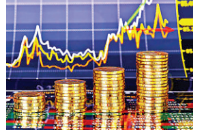
22.177 अरब डॉलर की बढ़ोतरी हो चुकी है। आरबीआई ने बताया कि 20 सितंबर को समाप्त सप्ताह में फॉरेन करेंसी एसेट्स 2.057 अरब डॉलर बढ़कर 605.686 अरब डॉलर पर पहुंच गया।

(ओडीओपी) योजना के अंतर्गत आने वाले उत्पादों के भी स्टॉल लगे हैं। खरीदारी के साथ ही खानपान और मनोरंजन के साधन भी उपलब्ध हैं। रोज शाम सांस्कृतिक कार्यक्रमों का आयोजन किया जा रहा है। ग्रेटर नोएडा प्राधिकरण ने भी ट्रेड शो में अपना स्टॉल लगाया है, जिसमें ग्रेटर नोएडा प्राधिकरण और आईआईटीजीएनएल ने अपना इंफ्रास्ट्रक्चर, भूखंडों की उपलब्धता, वर्तमान में चल रही वीपीओ/आईटी व वाणिज्यिक योजना आदि को प्रदर्शित किया है। ग्रेटर नोएडा में उद्योग, रिहायश, संस्थागत, कॉर्पोरेट भूखंडों में निवेश के लिए लोग काफी उत्सुक दिख रहे हैं। इसके साथ ही ग्रेटर नोएडा की ग्रीनरी और सड़कें भी लोगों को बहुत आकर्षित कर रही हैं।