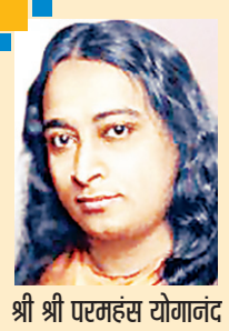
श्री श्री परमहंस योगानंद

जीवन के क्षण-मंगूर स्वार्जों के साथ मोह न रखें। ईश्वर और मात्र ईश्वर के लिए ही जीयें। इस संसार में मुक्ति और सुरक्षा का केवल यही मार्ग है, ईश्वर से परे कोई और सुरक्षा नहीं है।