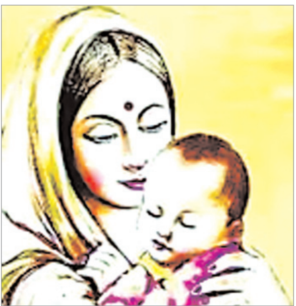
प्रकार की सब्जियों का सेवन किया। यह मान्यता है कि जो जितना बांटता है, उसके संतान की आयु में उतनी बढ़ोतरी होती है। आज सुबह सुबोधन से पूर्व महिलाएं ओहंगन (अल्हाहार) करके निर्जला व्रत की शुरुआत

नवीन मेल संवाददाता लातेहार। संतान की दीर्घायु, सुखी और निरोगी जीवन के लिए जितिया व्रत रखा जाता है। यह व्रत हर वर्ष अश्विन मास के कृष्ण पक्ष की अष्टमी तिथि को रखा जाता है। समातन संस्कृति में संतान की लंबी आयु और अच्छे स्वास्थ्य की कामना के लिए जितिया व्रत की पुरातन परंपरा रही है। इस जितिया पर्व में माताएं पूरी एक तिथि निर्जला उपवास रखकर जीमूतवाहन की आराधना करती हैं। इस व्रत की शुरुआत एक खस और अनाखी परंपरा से होती है, जो व्रत से एक दिन पहले निर्भाई जाती है। कल निर्जला व्रत शुरू करने से पहले आज महिलाओं ने परंपरागत मान्यताओं के अनुसार मडुआ की रोटी और पांच