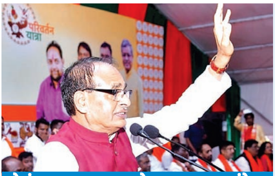
हेमंत आएगा, दाना डालेगा, एक हजार बांटेगा

पूर्वी सिंहभूम । झारखंड में भाजपा की परिवर्तन यात्रा सोमवार को कोल्हान प्रमंडल के बहरागोड़ा विधानसभा क्षेत्र के पवित्र चित्रवेश्वर धाम में पूजा-अर्चना के बाद प्रारंभ हुई। इसके बाद बहरागोड़ा के शाखा मैदान में एक विशाल जनसभा को संबोधित करते हुए केंद्रीय कृषि मंत्री एवं झारखंड विधानसभा में भाजपा के प्रभारी शिवराज सिंह चौहान ने कहा, राज्य में अंधेरा छटेगा, सूरज निकलेगा, कमल खिलेगा और परिवर्तन आएगा। चौहान ने कहा कि करीब 2.87 लाख से ज्यादा सरकारी नौकरियां खाली हैं और भाजपा की सरकार बनते ही, पहली कैबिनेट बैठक में नौजवानों को रोजगार देने का फैसला लिया जाएगा। उन्होंने जोर देकर कहा कि यह झामुमो नहीं, बल्कि जुर्म, मर्डर और माफिया की सरकार है, जिसे हेमंत सोरेन चला रहे हैं। शिवराज ने हेमंत सोरेन पर कटाक्ष करते हुए कहा, हेमंत सोरेन ने वादा किया था कि 5 लाख सरकारी नौकरियां देगे लेकिन चार साल और 10 महीने बीत गए और कुछ नहीं किया। अब चुनाव के नजदीक आते ही दौड़ कराने लगे, जिसमें 15 नौजवानों की जान चली गई।