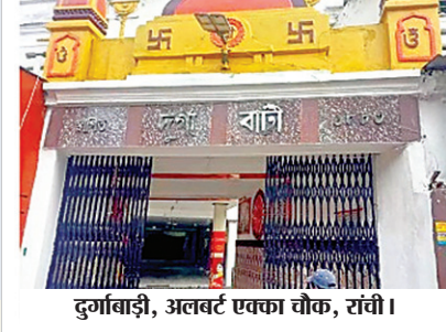
दुर्गाबाड़ी, अलबर्ट एक्का चौक, रांची।