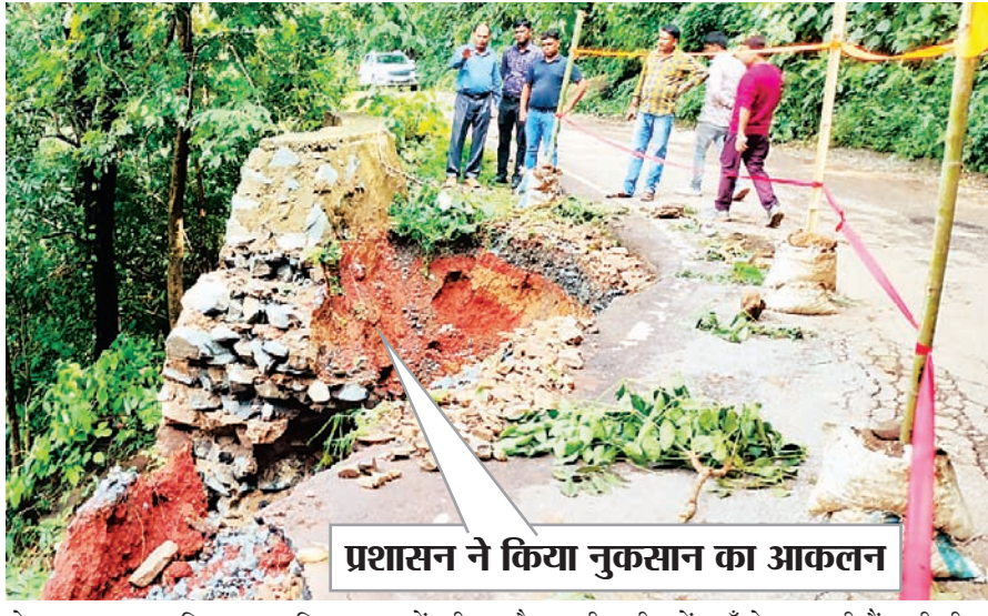
प्रशासन ने किया नुकसान का आकलन