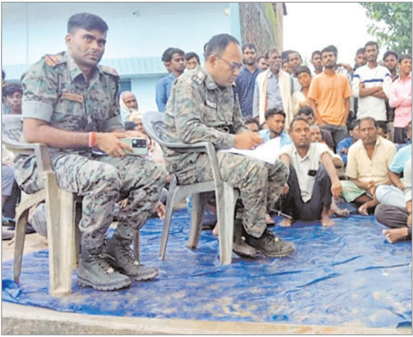
नवीन मेल संवाददाता डंडई। थाना क्षेत्र के करके गांव में भगवान विश्वकर्मा की पूजा और संत परिहार की जयंती मनाने को लेकर दलित और विश्वकर्मा समाज के बीच मंगलवार को दिनभर तनाव