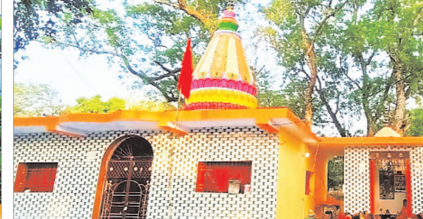
महादेव- विश्वकर्मा मंदिर