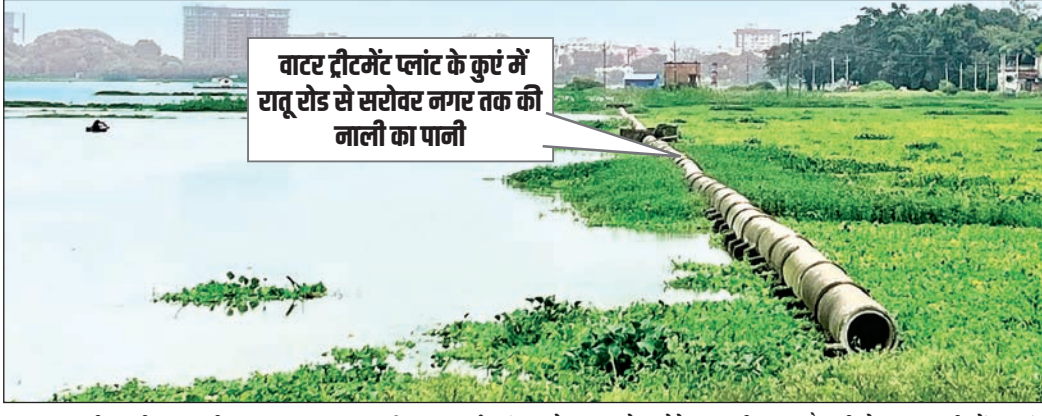
वाटर ट्रीटमेंट प्लांट के कुएं में रातू रोड से सरोवर नगर तक की नाली का पानी

सरोवर नगर के पास बन रहे सीवरेज वाटर ट्रीटमेंट प्लांट के कुएं में रातू रोड से सरोवर