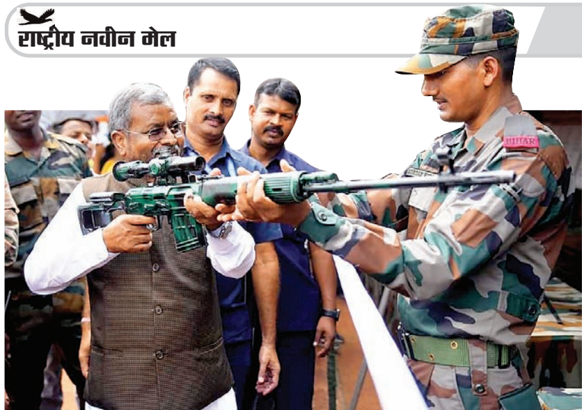
भाजपा प्रदेश अध्यक्ष एवं पूर्व मुख्यमंत्री बाबूलाल मरांडी ने शनिवार को मोरहाबादी मैदान में आयोजित सैन्य प्रदर्शनी का अवलोकन किया।