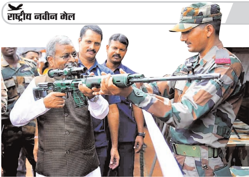
भाजपा प्रदेश अध्यक्ष एवं पूर्व मुख्यमंत्री बाबूलाल मरांडी ने शनिवार को मोरहाबादी मैदान में आयोजित सैन्य प्रदर्शनी का अवलोकन किया।