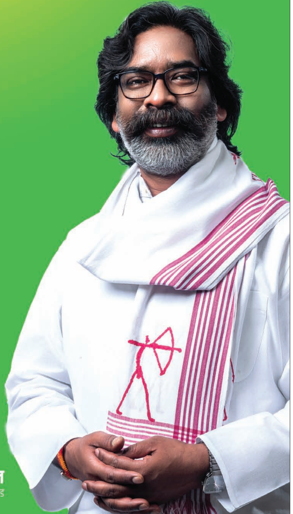
हेमन्त सोरेन मुख्यमंत्री, झारखण्ड