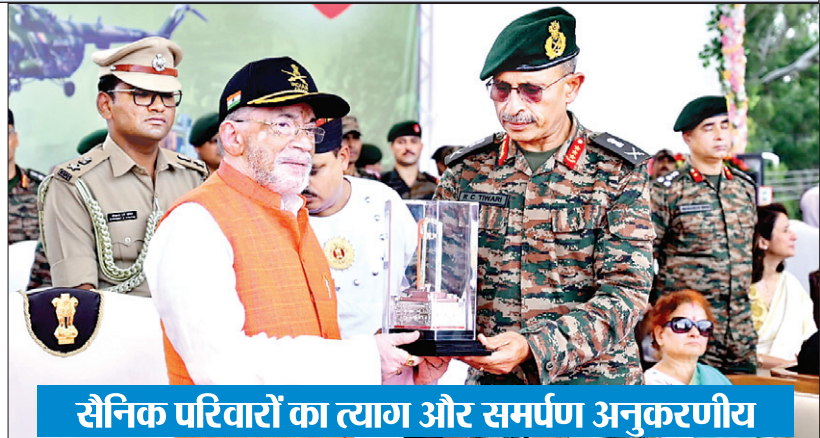
सैनिक परिवारों का त्याग और समर्पण अनुकरणीय

▶ भारतीय सेना की बढ़ती ताकत को करीब से जान सकेंगे युवा और आम लोग