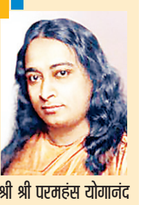
श्री श्री परमहंस योगानन्द

बोधि वृक्ष ध्वनि की अन्नत क्षमताएँ सुजातात्मक शब्द, ओम् से उद्भूत होती हैं, जो सब अणुशक्तियों के मूल में स्थित ब्रह्माण्डीय स्पन्दनशक्ति है। स्पष्ट अनुभूति और गहरी एकाग्रता के साथ उच्चारित किसी भी शब्द में मूर्त रूप लेने की शक्ति होती है।