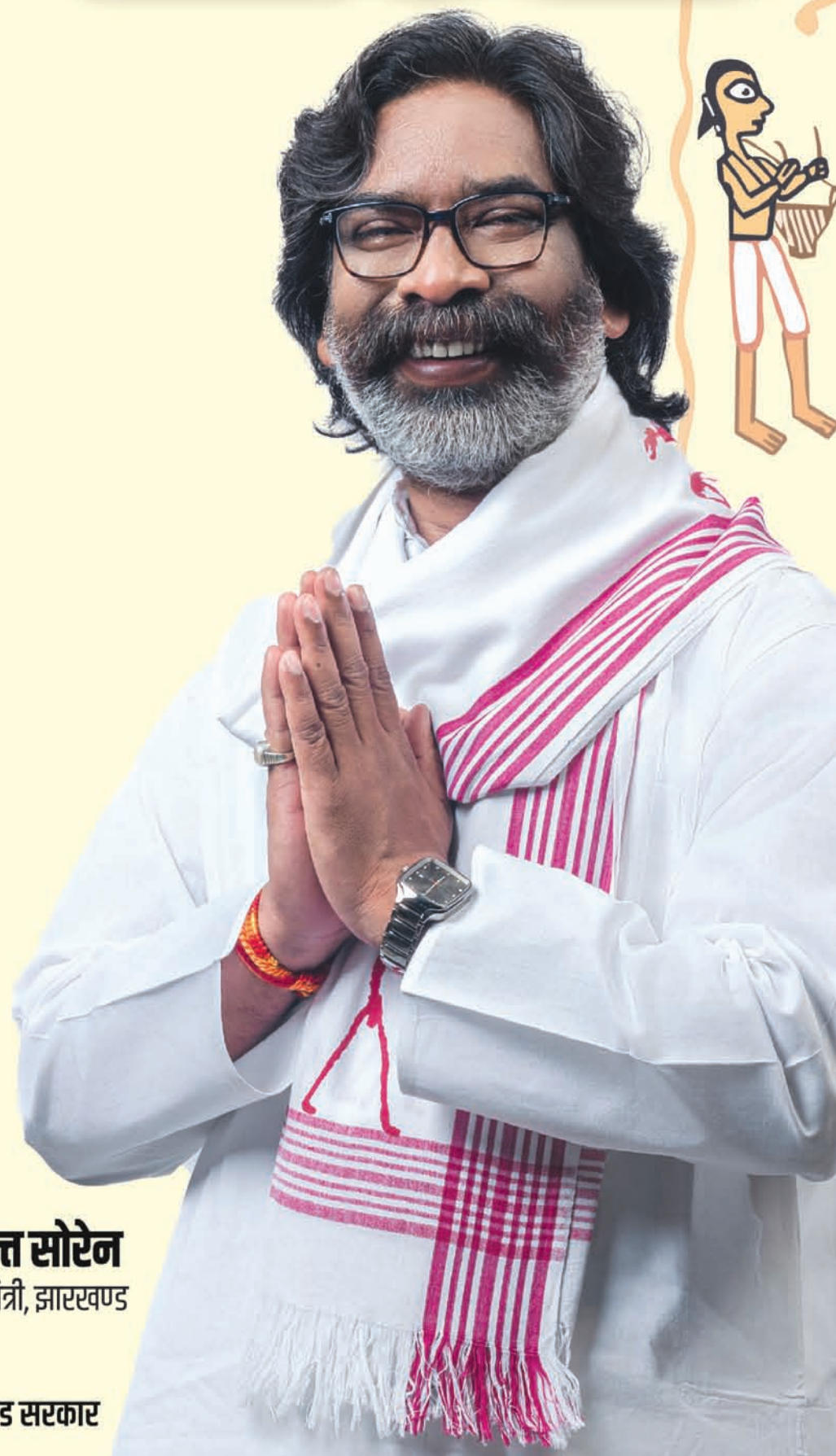
हेमन्त सोरेन मुख्यमंत्री, झारखण्ड