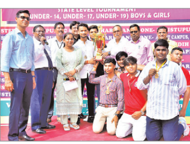
आज इतनी ट्रॉफियां का समय याद आ गया। मुझे बच्चों के कार्यक्रम में आनंद अछा लगता है।