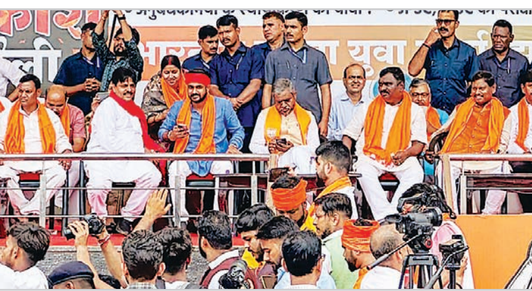
हेमंत युवाओं का आक्रोश देखकर डरे सहमे हैं