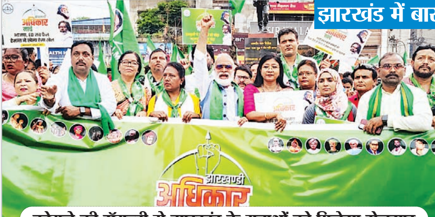
कोयले की राँयल्टी से झारखंड के युवाओं को मिलेगा रोजगार