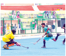
नवीन खेल संवाददाता

रांची। राज्यस्तरीय नेहरू कप हॉकी प्रतियोगिता 2024-25 के दूसरे दिन अंडर 17 बालिका वर्ग मुकाबले के सेमीफाइनल में रांची ने खूंटी को 5-0 से और सिमडेगा ने हजारीबाग को 07-1 से पराजित कर फाइनल में