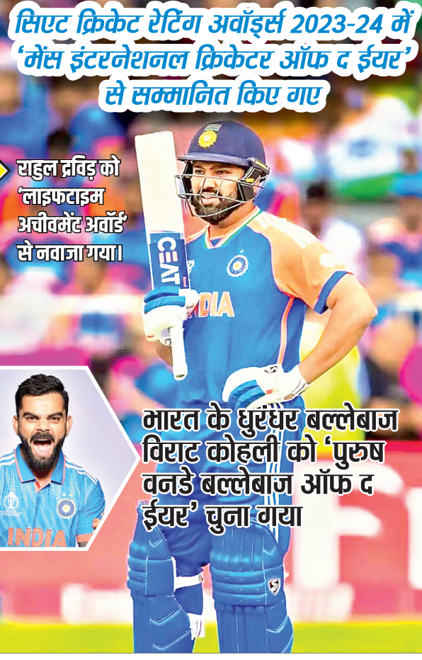
सिफ्ट क्रिकेट रेटिंग अवॉर्ड्स 2023-24 में 'मैन्स इंटरनेशनल क्रिकेटर ऑफ द ईयर' से सम्मानित किए गए

एजेंसी। मुंबई। भारत के कप्तान रोहित शर्मा को बुधवार को यहां सिफ्ट क्रिकेट रेटिंग अवॉर्ड्स 2023-24 में 'मैन्स इंटरनेशनल क्रिकेटर ऑफ द ईयर' से सम्मानित किया गया, जबकि पूर्व मुख्य कोच राहुल द्रविड़ को 'लाइफटाइम अचीवमेंट अवॉर्ड' से नवाजा गया। भारत के थुरंधर बल्लेबाज विराट कोहली को 'पुरुष वनडे बल्लेबाज ऑफ द ईयर' चुना गया, जबकि गेंदबाजी में मोहम्मद शमी को 'वनडे बॉलर ऑफ द ईयर' का पुरस्कार दिया गया। 2023 वनडे विश्व कप के दौरान शमी का उत्कृष्ट प्रदर्शन, जहां वह 24 विकेट के साथ सबसे अधिक विकेट लेने वाले गेंदबाज के रूप में उभरे। इस साल की शुरुआत में इंग्लैंड के खिलाफ पांच टेस्ट मैचों की श्रृंखला में 712 रन बनाने वाले युवा सनसनी यशस्वी जायसवाल को 'पुरुष टेस्ट बल्लेबाज ऑफ द ईयर' के रूप में सम्मानित किया गया था। टेस्ट क्रिकेट में जायसवाल का उत्थान शानदार रहा है, उनके असाधारण प्रदर्शन को व्यापक प्रशंसा मिली है। अनुभवी ऑफ स्पिनर रविचंद्रन अश्विन को 'वर्ष का पुरुष टेस्ट गेंदबाज' नामित किया गया। बीसीसीआई सचिव जय शाह को भारतीय क्रिकेट में उनके योगदान के लिए 'खेल प्रशासन में उत्कृष्टता पुरस्कार' से सम्मानित किया गया।