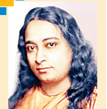
श्री श्री परमहंस योगानंद

यदि आप ध्यान के द्वारा अपने मन को शुद्ध एवं विस्तारित कर सकें, तथा ईश्वर को अपनी चेतना में ला सकें, तो आप भी रोग, बीमाओं और मृत्यु के भ्रम से मुक्त हो जाएंगे।