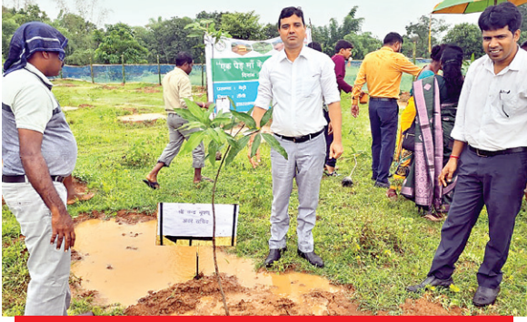
हम सभी एक पेड़ मां के नाम महोत्सव का हिस्सा बनें

झारखंड में जल- जंगल और जमीन हमेशा से ही हमारे जीने का जरिया रहा है। लेकिन, सदियों से चली आ रही ये व्यवस्था अन्धधुंध विकास और शहरीकरण की वीड में पीछे छूटती जा रही है। आज हरे- भरे पेड़ों से आच्छादित जंगल की जगह कंक्रीट के जंगल ने ले ली है। इसका सीधा असर हमारे पर्यावरण पर पड़ रहा है। प्राकृतिक संतुलन बिगड़ रहा है। अगर हम अब भी नहीं चेते तो इसके गंभीर परिणाम भुगतने को तैयार रहना होगा। आज जरूर इस बात की है कि पर्यावरण संरक्षण की खातिर ज्यादा से ज्यादा पेड़ लगाने के अभियान का हम हिस्सा बनें और पेड़ों को बचने का संकल्प लें। सभी के सहयोग और भागीदारी से प्राकृतिक व्यवस्था को संरक्षित मानव जीवन को सुरक्षित रख सकते हैं। ग्रामीण विकास विभाग के संयुक्त सचिव अरुण कुमार सिंह गुरुवार को एक पेड़ मां के नाम अभियान के तहत रांची जिला अंतर्गत बेड़ो प्रखंड में ग्रामीणों को संबोधित करते हुए ये बातें कही।