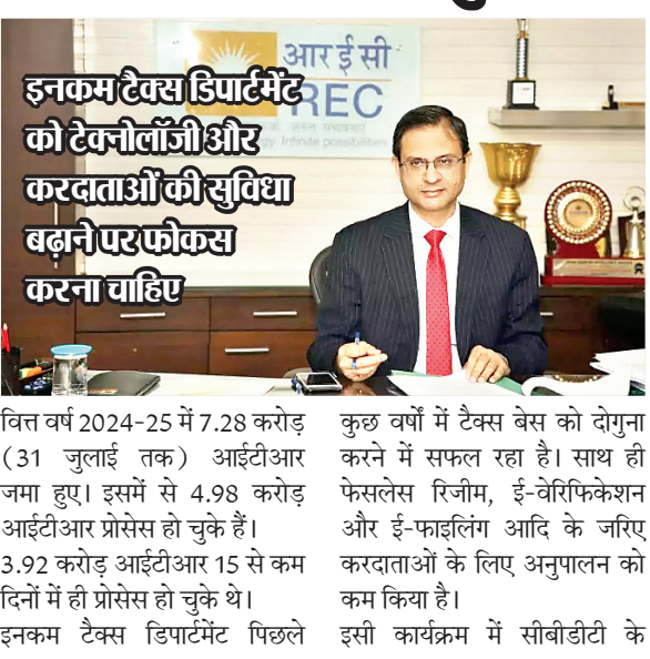
इनकम टैक्स डिपार्टमेंट को टेक्नोलॉजी और करदाताओं की सुविधा बढ़ाने पर फोकस करना चाहिए।

एजेंसी। नई दिल्ली। भारत का प्रत्यक्ष कर संग्रह पिछले दस वर्षों में 5.59 लाख करोड़ रुपये से बढ़कर 20 लाख करोड़ रुपये हो गया है। इस दौरान टेक्स-टू जीडीपी रेश्यो भी बढ़कर 6 प्रतिशत पर पहुंच गया है, जो कि पहले 5.6 प्रतिशत था। राजस्व सचिव संजय मल्होत्रा ने यह जानकारी दी। 'इनकम टैक्स डे' पर अपने संबोधन में उन्होंने कहा कि इनकम टैक्स डिपार्टमेंट को टेक्नोलॉजी और करदाताओं की सुविधा बढ़ाने पर फोकस करना चाहिए। इसके साथ ही उन्होंने इनकम टैक्स डिपार्टमेंट के तेजी से काम करने को भी हाईलाइट करते हुए कहा कि