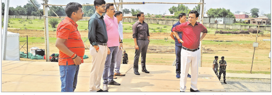
नवीन मेल संवाददाता मेदिनीनगर। राज्य के मुख्यमंत्री प्रमंडलस्तरीय कार्यक्रम में भाग लेने बुधवार पलामू जिला के सदर प्रखंड अंतर्गत चियांकी हवाई अड्डा पहुंचेगे। वे चियांकी से प्रमंडल के तीनों जिलों के मुख्यमंत्री मइयां सम्मान योजना के लाभुकों को पहली किस्त जारी करेंगे। इसी को