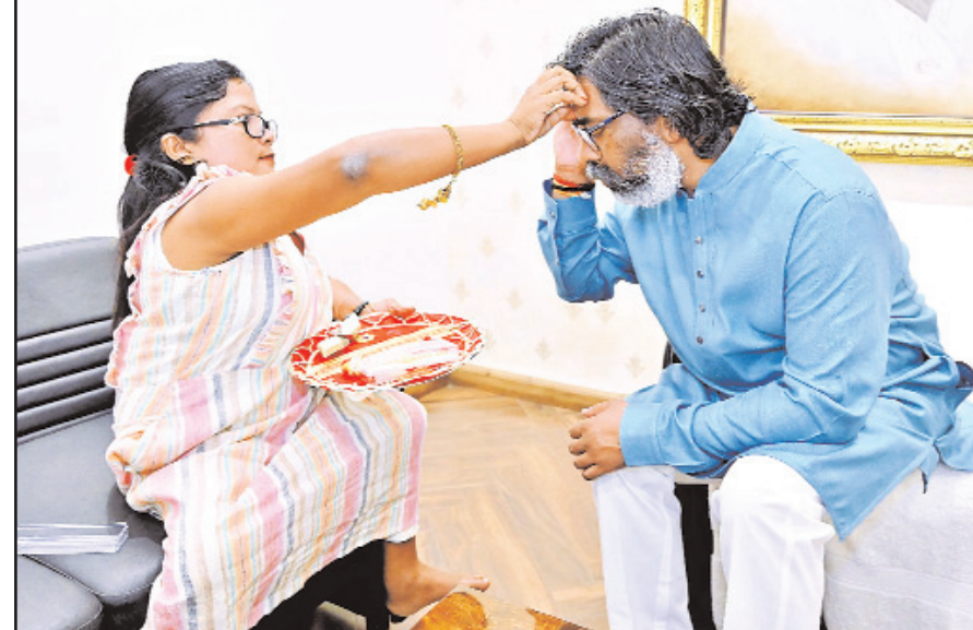
रक्षाबंधन पर सोमवार को रांची के कांके रोड स्थित मुख्यमंत्री आवास में दुमका जिले के शिकारीपाड़ा प्रखंड स्थित सीतासाल निवासी मति सोरेन ने मुख्यमंत्री हेमंत सोरेन को कलार्पण पर रक्षापुत्र बांधकर उनके उत्तम स्वास्थ्य एवं सुदीर्घ जीवन की कामना की। इस अवसर पर मुख्यमंत्री ने उन्हें सहृदय आशीर्वाद एवं शुभकामनाएं दी।

नवीन मेल संवाददाता रांची। मुख्यमंत्री हेमंत सोरेन ने भाई-बहन के अटूट प्यार, स्नेह एवं विश्वास के पावन त्योहार रक्षाबंधन के अवसर पर सभी को बधाई एवं शुभकामनाएं दी है। उन्होंने एक्स हैंडल पर किए पोस्ट में लिखा है कि राज्य की आधी आबादी को हक-अधिकार और सम्मान देने के लिए आपके इस भाई और बेटे तथा झारखंड सरकार ने पिछले साढ़े चार वर्षों में कई ऐतिहासिक योजनाओं को धरातल पर उतारने का काम किया है। मुख्यमंत्री ने पोस्ट में लिखा है कि झारखंड मुख्यमंत्री मईयां सम्मान योजना (जेएमएमएसवाई) के अंतर्गत राज्य की 48 लाख से