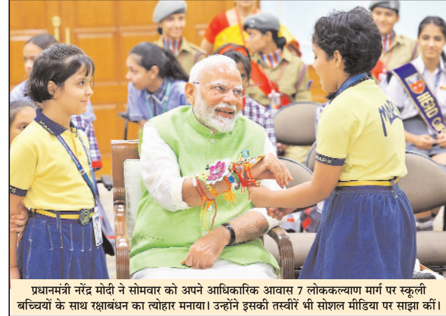
प्रधानमंत्री नरेंद्र मोदी ने सोमवार को अपने आधिकारिक आवास 7 लोककल्याण मार्ग पर स्कूली बच्चियों के साथ रक्षाबंधन का त्योहार मनाया। उन्होंने इसकी तस्वीरें भी सोशल मीडिया पर साझा कीं।

आहत हैं, जिस तरह से उन्हें मुख्यमंत्री पद से हटाया गया, उससे उन्होंने काफी अपमानित महसूस किया। चंपाई सोरेन ने पोस्ट में कहा है कि तीन जुलाई को पार्टी विधायकों की बैठक में उनसे इस्तीफा देने को कहा गया। उन्होंने कहा कि वह इस निर्देश से आहत थे। क्योंकि, उनके आत्मसम्मान को ठेस पहुंची थी। पूर्व मुख्यमंत्री के अनुसार, उन्होंने बैठक में घोषणा की थी कि आज से उनके जीवन का एक नया अध्याय शुरू होगा। भाजपा द्वारा विधायकों की खरीद-फरोख्त करने संबंधी मुख्यमंत्री हेमंत सोरेन के आरोपों पर मरांडी ने कहा कि इसका मतलब यह है कि वह (हेमंत) कह रहे हैं कि उनके विधायक 'बिकाऊ' हैं। यदि आप (हेमंत) सभी विधायकों को 'बिकाऊ' कहेंगे, तो कौन आपके साथ रहना चाहेगा।