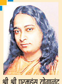
श्री श्री परमहंस योगानंद

जब आप जीवन के अनुभवों का प्रयोग आपने शिक्षक के रूप में करते हैं और उनसे इस संसार के सच्चे स्वरूप एवं उसमें आपनी भूमिका के बारे में सीखते हैं, तो वे अनुभव शाश्वत परिपूर्णता एवं प्रसन्नता के मूल्यवान मार्गदर्शक बन जाते हैं।