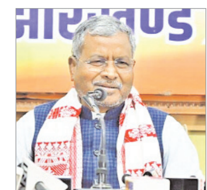
के भाजपा में शामिल होने के सवाल पर कहा कि इस सिलसिले में चंपाई सोरेन से अभी कोई बातचीत नहीं हुई है। चंपाई के सोशल मीडिया पोस्ट का जिक्र करते हुए प्रदेश भाजपा अध्यक्ष ने कहा कि इससे संकेत मिलता है कि वह बहुत

नवीन मेल संवाददाता रांची। भाजपा के प्रदेश अध्यक्ष बाबूलाल मरांडी ने सोमवार को चंपाई सोरेन के भाजपा में शामिल होने की चर्चा के बीच अपनी प्रतिक्रिया दी है। मरांडी ने कहा है कि भाजपा में शामिल होने के संबंध में चंपाई सोरेन से अभी तक कोई बातचीत नहीं हुई है। चंपाई सोरेन एक मंझे हुए राजनेता हैं और झारखंड अलग राज्य के गठन के लिए चलाए गए आंदोलन का हिस्सा रह चुके हैं। जिस तरह से उन्हें मुख्यमंत्री के पद से हटाया गया, उससे वे आहत हैं। वह अपनी आगे की राह के बारे में निर्णय खुद लेंगे। मुख्यमंत्री हेमंत सोरेन के आरोपों के सवाल पर कहा कि यदि कोई विधायक अपना दुख व्यक्त करता है, तो उनकी बात सुनी चाहिए। चंपाई