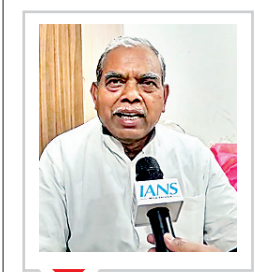
2024 लोकसभा चुनाव में भाजपा बेनकाब हो गई है। झारखंड सरकार को गिराने के लिए सभी ताकतें लगी हुई हैं।