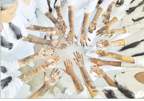
उनमें छिपी प्रतिभाओं को भी निखारा जाता है।