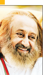
गुरुदेव श्री श्री रवि शंकर

डिप्रेशन, क्रोध और बुरे व्यवहार के दुष्क्रम में फंस जाते हैं। आपको इस बात का अहसास भी नहीं होता कि आपका व्यवहार अच्छा नहीं है। असुरक्षा की भावना से आप जीवन में बहुत सारे अच्छे अवसर और कोई भी नई पहल करने का उत्साह खो देते हैं। असुरक्षा की भावना आपको प्रीति, सुख और आनंदमय जीवन का अंत है।