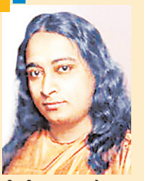
श्री श्री परमहंस योगिनंद

मैं परिस्थितियों को दोष नहीं देता और न ही किसी अन्य व्यक्ति को सुधारने का प्रयास करता हूँ। सर्वप्रथम मैं अपने भीतर में जाता हूँ। मैं अपनी आत्मा के किले की सफाई करने का प्रयास करता हूँ ताकि किसी भी ऐसी वस्तु को हटा सकूँ जो