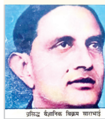
श्रीमान् विक्रम साराभाई

बेंगलूरु स्थित भारतीय विज्ञान संस्थान में नौकरी करने लगे। जहां पर वह सी. वी. रमन के निरीक्षण में कॉस्मिक रेज पर अनुसंधान करने लगे। द्वितीय विश्वयुद्ध की समाप्ति पर वे कॉस्मिक रेज भौतिक विज्ञान के क्षेत्र में अपनी डॉक्टरेट पूरी करने के लिए कैंब्रिज लौट गए। सन् 1947 में उष्णकटिबंधीय अक्षांश ट्रॉपिकल लैटिट्यूड्स में कैंब्रिज विश्वविद्यालय ने उन्हें डॉक्टरेट की उपाधि से सम्मानित किया गया। डॉ विक्रम साराभाई को भारत के महान संस्थान निर्माता माना जाता है। उनके द्वारा स्थापित लोकप्रिय संस्थानों में प्रमुख हैं भौतिकी अनुसंधान प्रयोगशाला पीआरएल अहमदाबाद, भारतीय प्रबंध संस्थान आई आई एम अहमदाबाद, सामुदायिक विज्ञान केंद्र अहमदाबाद, दर्पण अकादमी फॉर परफॉर्मिग आर्ट्स अहमदाबाद, विक्रम साराभाई अंतरिक्ष केंद्र तिरुवनेंतपुर, डॉ विक्रम साराभाई सांस्कृतिक गतिविधियों में भी गहरी रूचि रखते थे। वे सगीत, फोटोग्राफी, पुरातत्व, ललित कलाओं और अन्य अनेक क्षेत्रों से जुड़े रहे। (लेखक वरिष्ठ स्वतंत्र पत्रकार एवं भारतीय जैन मिलन के राष्ट्रीय वरिष्ठ उपाध्यक्ष हैं।)