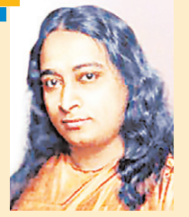
श्री श्री परमहंस योगानंद

आप जो भी कार्य करने का निश्चय कर लें, उसे कर सकते हैं। ईश्वर प्रत्येक वस्तु का योगफल है, और उनका प्रतिबिम्ब आपके भीतर है। वे कोई भी कार्य कर सकते हैं, और वैसे ही आप भी कर सकते हैं।