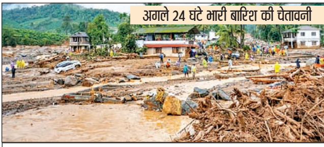
अगले 24 घंटे भारी बारिश की चेतावनी

हिमाचल प्रदेश के विभिन्न हिस्सों में जोरदार बारिश ने तांडव मचा दिया है। बाढ़ व भूस्खलन से कई इलाकों में जनजीवन अस्तव्यस्त है। जनजातीय जिला किन्नोर के पूह तहसील में फ्लैश फ्लड से भयंकर भूस्खलन हुआ है। पूह से रौरिक तक नेशनल हाइवे के कई किलोमीटर हिस्से में भारी भूस्खलन हुआ है। इससे हाइवे पूरी तरह बाधित हो गया है। माना जा रहा है कि वादल फटने के बाद यहां फ्लैश फ्लड आया है। हालाँकि फ्लैश फ्लड व भूस्खलन से किसी के हताहत होने की रिपोर्ट नहीं है। उधर, सिरमौर जिला में बीती रात से हो रही मूसलाधार वर्षा से गिरी, यमुना और मारकंडा नदियों में रौद्र रूप धारण कर लिया है और प्रशासन ने लोगों को नदी नालों से दूर रहने की सलाह दी है। सिरमौर जिला के मुख्यालय नाहन के बनकला पंचायत में उफनती नारकंडा नदी तबाही मचा रही है। रविवार की सुबह बनकला में नदी किनारे बना मंदिर को सैलाब बहा ले गया। पलक झपकते ही मंदिर पानी में समा गया। नाहन इलाके की सलानी कटौला पंचायत में नदी का