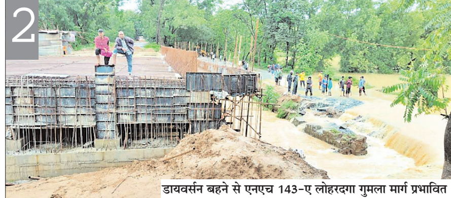
डायवर्सन बहने से एनएच 143-ए लोहरदगा गुमला मार्ग प्रभावित