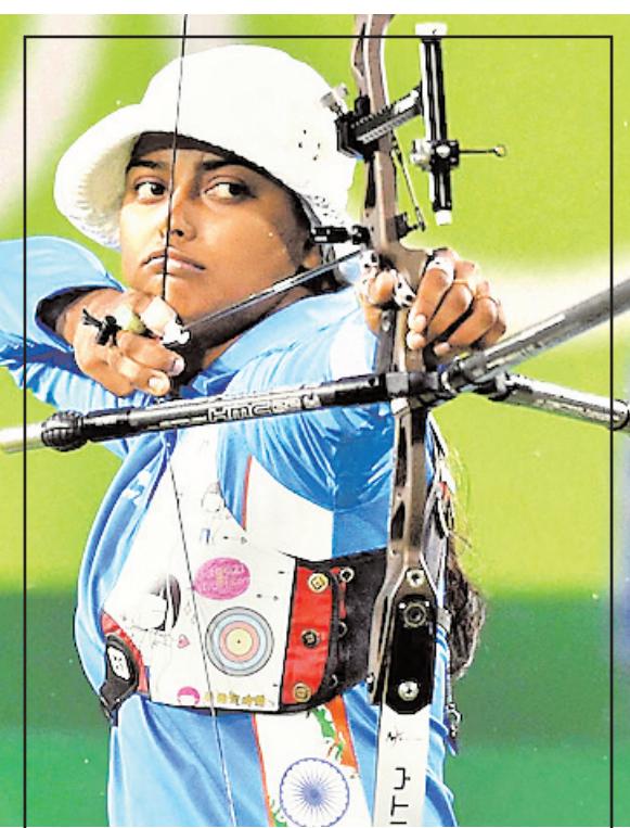
जर्मन प्रतिद्वंद्वी के खिलाफ 6-4 (2-0, 1-1, 2-0, 0-2, 1-1) से जीत हासिल की थी