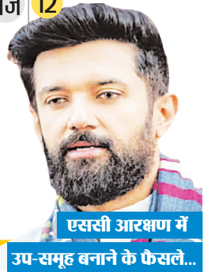
एससी आरक्षण में उप-समूह बनाने के फैसले...