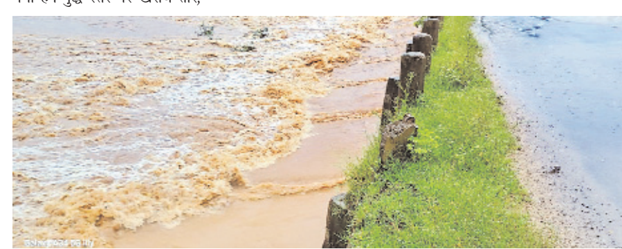
बारिश से पुल का अप्रोच को नुकसान, भारी वाहन का आवागमन ठप

महुआडांड। महुआडांड प्रखंड में दो दिनों से हो रही लगातार बारिश से किसान काफी खुश है। वहीं दूसरी ओर किसान चिंतित हैं। लगातार बारिश से धान की खेती के लिए पानी अच्छी है, लेकिन मक्का की खेती को काफी नुकसान हो रहा है। मक्का के पौधा भारी में जमीन की ओर झुक जा रहे हैं। लगातार बारिश से कई खेत