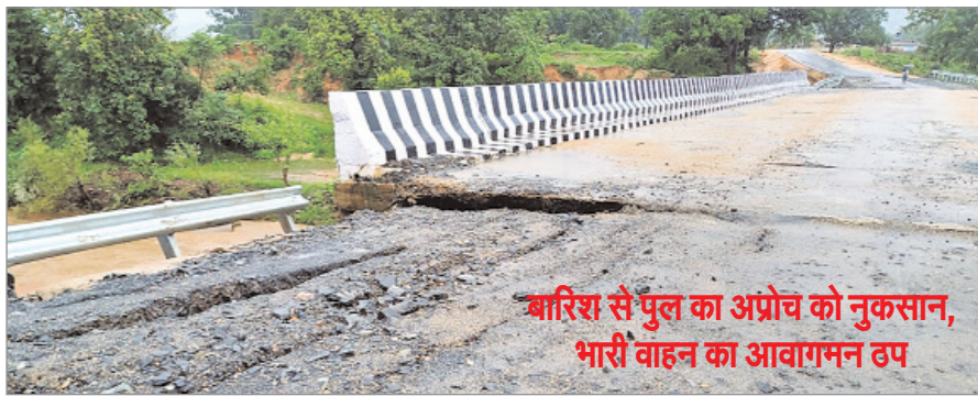
बारिश से पुल का अप्रोच को नुकसान, भारी वाहन का आवागमन ठप

नवीन खेल संवाददाता महुआडांड। महुआडांड प्रखंड अंतर्गत बासकरचा मोड़ से कुंडो