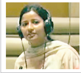
पुराने कट ऑफ से पंकरी बरवाडीह के विस्थापितों के साथ अन्याय हो रहा है, विस्थापन एवं मुआवजा का उचित लाभ नहीं मिल रहा : अंबा

2016 में खनन शुरू किया गया। कंपनी जिस स्थान पर 2016 में लोगों को विस्थापित की उनके लिए समझा जा सकता है कि 2016 का कट ऑफ हो। पर कंपनी हर साल अलग अलग जगह पर खनन शुरू करती है और लोगों को विस्थापित करती है। इसलिए न्याय यह है कि विस्थापन करने वाले वर्ष को मुआवजे के लिए कट ऑफ माना जाय ना की फिक्स करके 2016 को। अभी भी नये जगहों को कट ऑफ माना जाय ना कि कट उनको मुआवजे का लाभ 2016 के