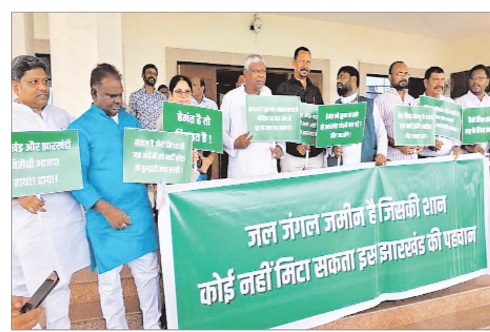
मिट जाओगे। कैसे लिया झारखंड लड़ के लिया झारखंड आदि स्लोगन लिखे हैं। विधानसभा सत्र शुरू होने के पूर्व सत्ता पक्ष के विधायकों ने भी प्रदर्शन किया और भाजपा सांसद निशिकांत दूबे के बयान के विरोध में नारे लगाये।