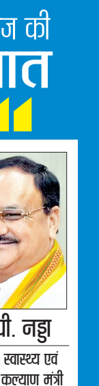
जे.पी. नड्डु केंद्रीय स्वास्थ्य एवं परिवार कल्याण मंत्री

कैबिनेट ने राज्य खाद्य-परीक्षण प्रयोगशालाओं को मजबूत करने के लिए ₹482 करोड़ की मंजूरी दी। एफएसएसएआई ने 'फूड सेफ्टी ऑन व्हील्स' नाम से मोबाइल फूड लैब उपलब्ध कराकर दूरदराज के इलाकों तक पहुंचना शुरू कर दिया है। इन उपलब्धियों का उत्सव मनावते समय, हम वैश्विक स्तर पर उपर रहे रहानों, जैसे कि प्लॉट बेस्ट प्रोटीन, प्रयोगशाला में विकसित मांस आदि को भी स्वीकार करना चाहिए। एफएसएसएआई ने नई श्रेणियों, जैसे - वीगन खाद्य पदार्थों, जैविक उत्पादों और आनुवंशिक आहार के लिए सक्रिय रूप से मानक विकसित किए हैं और यह खाद्य-सुरक्षा के उभरते रहानों के अनुरूप निरंतर अनुकूलन कर रहा है। जैसे-जैसे वैश्विक खाद्य व्यापार का विस्तार हो रहा है, एफएसएसएआई कोडेक्स जैसे विभिन्न मंचों पर अंतरराष्ट्रीय नियामकों के साथ साझेदारी कर रहा है। इसका उद्देश्य बढ़ती आबादी के लिए सुरक्षित और पौष्टिक भोजन सुनिश्चित करने के लिए सर्वोत्तम प्रथाओं को साझा करना और सामंजस्यपूर्ण दृष्टिकोण विकसित करना है। एफएसएसएआई ने 2023 में दिल्ली में पहला वैश्विक खाद्य नियामक शिखर सम्मेलन (जीएफआरएस) भी आयोजित किया, जो खाद्य नियामकों के लिए उपभोक्ता-सुरक्षा चुनौतियों के बारे में मिलने और विचार-विमर्श करने के लिए अपनी तरह का पहला सहयोगी मंच है। एफएसएसएआई आने वाले महीनों में जीएफआरएस के दूसरे संस्करण के लिए तैयार