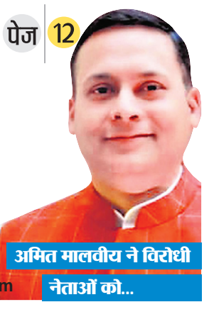
अमित मालवीय ने विरोधी नेताओं को...