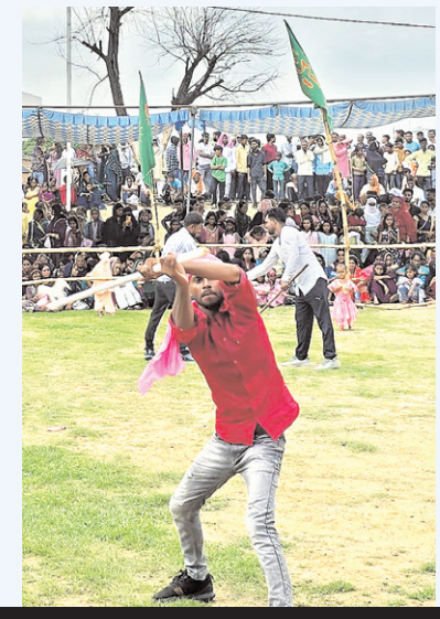
मुहर्रम के मातमी जुलूस में शामिल लोग व करतब दिखाते कलाकार