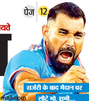
सर्जरी के बाद मैदान पर लौटे मो. शमी...