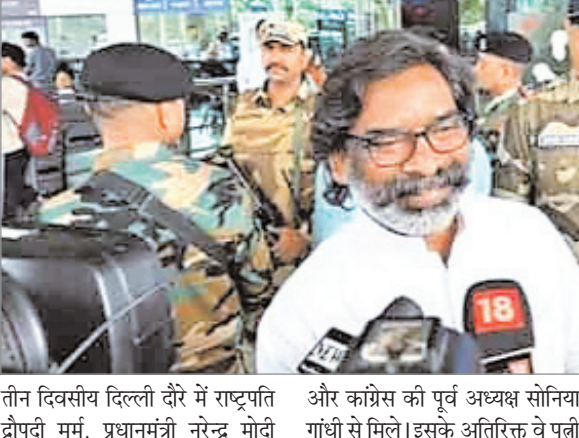
तीन दिवसीय दिल्ली दौरे में राष्ट्रपति द्रौपदी मुर्मू, प्रधानमंत्री नरेन्द्र मोदी और काग्रिस की पूर्व अध्यक्ष सोनिया गांधी से मिले। इसके अतिरिक्त वे पत्नी संग बनारस गये, जहां उन्होंने काशी विश्वनाथ में पूजा-अर्चना की।

नवीन मेल संवाददाता रांची। मुख्यमंत्री हेमंत सोरेन मंगलवार शाम तीन दिवसीय दिल्ली दौरे के बाद रांची लौटे आये। बिस्सा मुंडा एयरपोर्ट पर मीडिया से बातचीत में उन्होंने कहा कि यात्रा की जानकारी, यात्रा की खबर, यात्रा लाइव आप सबों ने देखा। उन्होंने कहा कि यह संघीय व्यवस्था का ढांचा है। केंद्र की सरकार को (मोदी) चला रहे हैं। राज्य की सरकार हम चला रहे हैं। हम उनका सम्मान करें और वो राज्यों का सम्मान करें। उल्लेखनीय है कि हेमंत सोरेन अपने