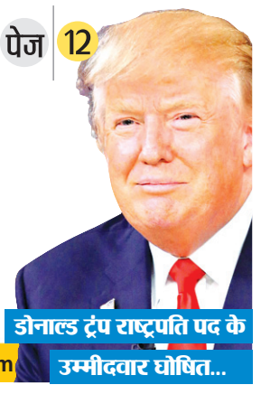
जोनाल्ड ट्रंप राष्ट्रपति पद के उम्मीदवार घोषित...