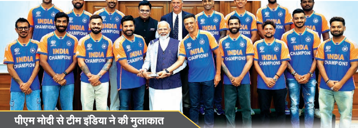
पीएम मोदी से टीम इंडिया ने की मुलाकात