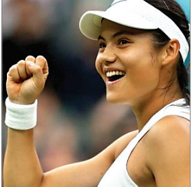
उठाया और अपने विरोधियों को पछाड़ दिया, इस प्रक्रिया में

एजेंसी। लंदन एम्मा राडुकानू एलिस मर्टेंस पर 6-1, 6-2 की जोरदार जीत के साथ घरेलू ग्रैंड स्लैम विम्बलडन में बुधवार को महिला एकल के तीसरे दौर में पहुंच गईं, जबकि उनकी हमनाम एम्मा नवारो ने पूर्व विश्व नंबर 1 नाओमी ओसाका को आसानी से 6-4, 6-1 से हराया। विम्बलडन के सेंटर कोर्ट पर दिन उन दोनों के नाम रहा क्योंकि उन्होंने अपने मौकों का पूरा फायदा