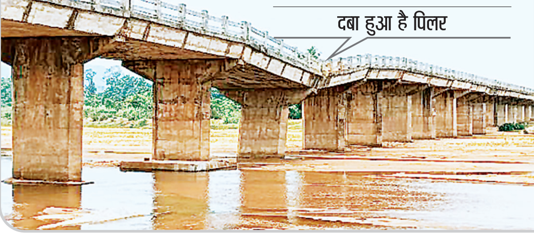
दबा हुआ है पिलर

नवीन मेल संवाददाता रायडीह। मरियम टोली शंख नदी पुल का पिलर पिछले 6 से 7 वर्षों से दबा हुआ है। जिसमें जान हथेली में रख कर लोग सफर कर रहे हैं। लेकिन विभाग एव झारखंड सरकार चैन कि नींद सो रही है। अरि जागेगी तब जब जब उस पुल पर कोई बड़ी घटना होगी। जब तक कोई बड़ी घटना ना हो सरकार जागने वाली नहीं है।