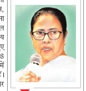
मैं खुद को कानूनी विरादरी का हिस्सा मानती हूँ। मैं अब भी बार एसोसिएशन की सदस्य हूँ।