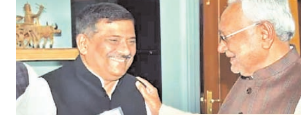
प्रस्ताव में कहा इसके तहत झारखंड में इस साल होने वाले चुनाव में भागीदारी करने का प्रस्ताव पास किया गया। प्रस्ताव में कहा गया कि वर्ष 2024 में जिन राज्यों में चुनाव होंगे, इनमें झारखंड प्रमुख है, जहां पहले भी हमारे प्रत्याशी चुनाव लड़े और जीते हैं। झारखंड पर विशेष ध्यान देते हुए हमें वहां की उन संतों को चिह्नित किया जाएगा जहां से हमारे प्रत्याशियों के चुनाव लड़ने की संभावना सबसे ज्यादा है। इसके बाद, चुनाव के लिए आगे की रणनीति बनाकर गंभीरता से जुट जाना होगा।