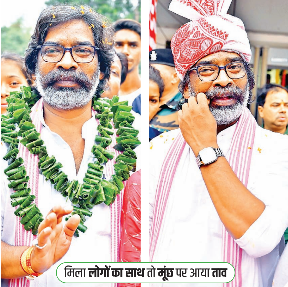
मिला लोगों का साथ तो मूँछ पर आया ताव