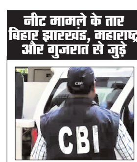
नीट मामले के तार विहाए झारखंड, महाराष्ट्र और गुजरात से जुड़े

एजेंसी। कोलकाता नीट पेपर लीक मामले को लेकर सीबीआई की टीम एक्शन मोड में है। एक के बाद एक ताबड़तोड़ छापेमारी की जा रही है। मामले की जांच के लिए शनिवार को सीबीआई की टीम गुजरात के जमालुदीन को भी गिरफ्तार किया है। जानकारी के मुताबिक पेपर लीक में उसके भी शामिल होने के सबूत सीबीआई अधिकारियों को मिले हैं। दरअसल, बिहार की आर्थिक अपराध शाखा ने जांच के