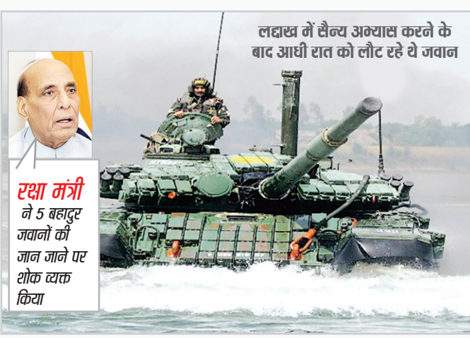
रक्षा मंत्री ने 5 बहादुर जवानों की जान जाने पर शोक व्यक्त किया

एजेंसी नई दिल्ली। चीन सीमा पर लाइन ऑफ एंक्टुअल कंट्रोल (एएलसी) के पास लद्दाख के दौलत बेग ओल्डी इलाके में सैन्य अभ्यास करते लौट रहे पांच जवानों की शुक्रवार रात करीब 1 बजे श्योक नदी पार करते समय मौत हो गई। लद्दाख के न्योमा-चुशुल इलाके में श्योक नदी का जलस्तर बढ़ने से टी-72 टैंक फंसा गया और सेना के 5 जवान बह गए। शनिवार को सभी सैनिकों के शव बरामद कर लिए गए। इनमें एक जूनियर कमीशन्ड ऑफिसर (जेसीओ) भी हैं। रक्षा मंत्री राजनाथ सिंह ने भारतीय सेना के पांच बहादुर जवानों की जान जाने