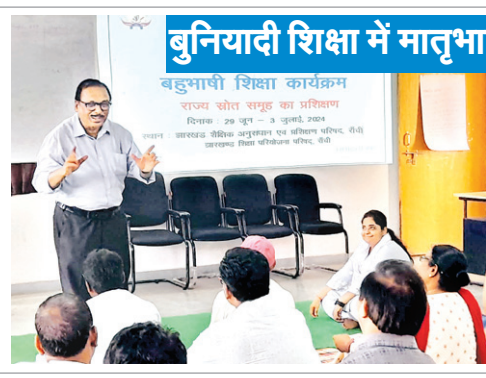
साहित्यबज्र, लातेहार, सिमडेगा के मास्टर ट्रेनर शामिल हो रहे हैं। प्रशिक्षित मास्टर ट्रेनर बहुभाषी शिक्षा के लिए राज्य स्तर पर समूह के रूप में कार्य करेंगे तथा इनके द्वारा भविष्य में संबंधित जिलों के चयनित

नवीन मेल संवाददाता। रांची राज्य में मातृभाषा आधारित बहुभाषी शिक्षण कार्यक्रम के सफल संचालन तथा इससे जुड़े अपेक्षित उच्चतम लक्ष्यों की प्राप्ति के लिए अपनायी जाने वाली शिक्षण प्रक्रिया तथा इस बहुउद्देशीय शिक्षण कार्यक्रम से संबंधित महत्वपूर्ण जानकारीयों से अवगत कराने के लिए शनिवार से प्रशिक्षण कार्यशाला शुरू हुई। राज्य के आठ जिलों के 45 चयनित शिक्षकों के लिए राठू स्थित झारखंड शैक्षिक अनुसंधान एवं प्रशिक्षण परिषद (जेसीईआरटी) में एलएलएफ संस्था के सहयोग से छह दिवसीय विशेष प्रशिक्षण कार्यशाला की शुरुआत हुई है। इस विशेष प्रशिक्षण कार्यशाला में दुमका, गुमला, खूँटी, लोहरागा, पश्चिमी सिंघभूम,