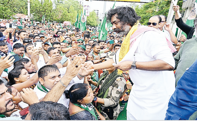
कार्यकर्ताओं और समर्थकों को संबोधित करते हुए कहा हेमंत ने

नवीन मेल संवाददाता रांची। बड़गाई जमीन घोटाले में जेल से बाहर आने के बाद शनिवार को झारखंड के पूर्व मुख्यमंत्री हेमंत सोरेन ने फिर से लड़ाकू तेवर दिखाते हुए बिना नाम लिए सूबे की प्रमुख विपक्षी दल भारतीय जनता पार्टी पर जमकर निशाना साधा। अपने आवास पर झामुमो