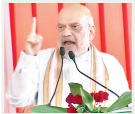
अमित शाह 21 को बिहार के कटिहार में करेंगे रैली