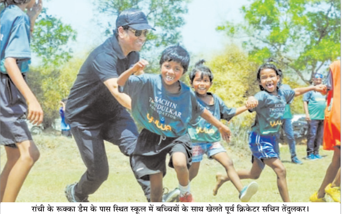
रांची के रूक्का डैम के पास स्थित स्कूल में बच्चियों के साथ खेलते पूर्व क्रिकेटर सचिन तेंदुलकर।

सं 2000 में झारखंड जब बना था तब पूरी दुनिया में इसकी चर्चा इस रूप में हो रही थी कि भारत की लगभग 40 प्रतिशत खनिज संपदा वाला यह प्रदेश अब विकास की वह लकीर खींचेगा जो दूसरों के लिए दुर्लभ है क्योंकि यह पहला राज्य था जहां का बजट सरप्लस यानी आय खर्च से अधिक थी। इसका पैतृक राज्य बिहार अपनी घटी हुई आय और संसाधनों का दुखड़ा रो रहा था और तत्कालीन मुख्यमंत्री लालू यादव सहित अनेक नेता यही बयान दे रहे थे कि बिहार क्या बालू फकिगा ? पहले मुख्यमंत्री बाबूलाल मरांडी ने अपने छोटे कार्यकाल में कुछ जमीनी योजनाओं सहित आधारभूत संरचना के विकास पर एक बड़ी लकीर खींची पर उनकी सरकार के गिरने के बाद से अल्पमत सरकारों और कुछ कार्यकाल पूरा करने वाले मुख्यमंत्रियों ने भी झारखंड को अच्छी पहचान देने के बजाय नए नए प्रयोग किए जिससे झारखंड, साथ ही अलग हुए दो राज्यों उत्तराखंड और छत्तीसगढ़ की तुलना में न सिर्फ पीछे रह गया बल्कि साल दर साल नए घोटालों के कारण राष्ट्रीय स्तर पर बदनाम होता चला गया। यहां की प्रतिभाएं उच्च शिक्षा के लिए दक्षिण के राज्यों और दिल्ली पलायन करने के बाद कभी नहीं लौटीं क्योंकि कमजोर नेतृत्व