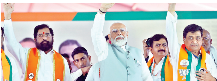
सभी मतदाताओं का धन्यवाद, सभी हिस्सा लें

एजेंसी। मुंबई/ तिरुवनंतपुरम प्रधानमंत्री नरेंद्र मोदी ने शनिवार को को महाराष्ट्र में एक रैली में इंडी गठबंधन पर जोरदार निशाना साधा। उन्होंने कहा कि इंडिया गठबंधन के सभी नेता अपना भ्रष्टाचार छुपाने के लिए एक साथ आए हैं, लेकिन पहले चरण के चुनाव में मतदाताओं ने इन्हें पूरी तरह से रिजेक्ट कर दिया। नरेंद्र मोदी ने कोजिपी उम्मीदवार के पक्ष में चुनावी रैली में प्रधानमंत्री नरेंद्र मोदी ने कहा, देश की 25 फीसद सीटों पर इंडिया गठबंधन के नेता एक-दूसरे के खिलाफ ही चुनाव लड़ रहे हैं। क्या देश की जनता किसी ऐसे पर भरोसा कर सकती है, जो अपने अगुवा पर ही भरोसा नहीं करते हों? अगर अपने ही मोर्चे में एक दूसरे को जेल में डालने की बात करने वाले लोग चुने जाते हैं, तो ये