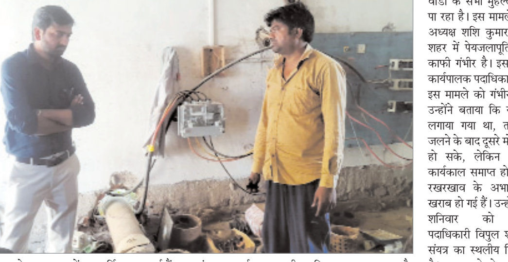
व्यवस्था के तहत शहर में जलापूर्ति की जा रही है। हुसैनाबाद शहर में 16 वार्ड हैं। नगर पंचायत कार्यालय द्वारा संविदा के आधार पर शहर में पानी का वितरण कराया जा रहा है, लेकिन यह वितरण प्रतिदिन सभी

नवीन मेल संवाददाता हुसैनाबाद। नगर पंचायत में छह दिनों से पूरी तरह पेयजलापूर्ति ठप पड़ गई है, जिससे शहर में पानी के लिए हाहाकार मचा हुआ है। देवरी सोन नदी में स्थित पानी टंकी के मोटर जल जाने के कारण पानी की आपूर्ति बंद है। मालूम हो कि हुसैनाबाद शहर के आधा से अधिक हिस्सा में खरा पानी है, जिससे लोग पेयजलापूर्ति पर ही निर्भर रहते हैं। पानी की आपूर्ति नहीं होने से पानी बेचने वाले व्यवसायियों की चांदी हो गई है और शहर के लोग एक गैलन पानी 30 से 40 रुपये में पानी खरीद कर अपनी प्यास बुझा रहे हैं। कार्यपालक पदाधिकारी विपुल शन्नी ने बताया कि वैकल्पिक