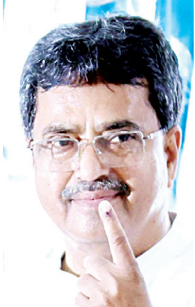
त्रिपुरा के मुख्यमंत्री माणिक साहा ने वोट डालने के बाद अपनी स्याही लगी उंगली दिखा लोनों को प्रेरित किया।