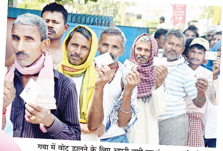
गया में वोट डालने के लिए अपनी बारी का इंतजार करते लोग।

राजस्थान के मुख्यमंत्री भजन लाल शर्मा शुक्रवार को जयपुर के नवोदय महिला शिक्षा प्रशिक्षण महाविद्यालय जगतपुरा में मतदान करने पहुंचे और उन्होंने मीडिया से बातचीत के दौरान विश्वास जताया कि इस बार भी बीजेपी इस सीट पर जीत का परचम लहराएगी। वह अपने पत्नी और बेटे के साथ मतदान करने पहुंचे। मतदान के बाद उन्होंने अपनी पत्नी और बेटे के साथ सेल्फी ली।