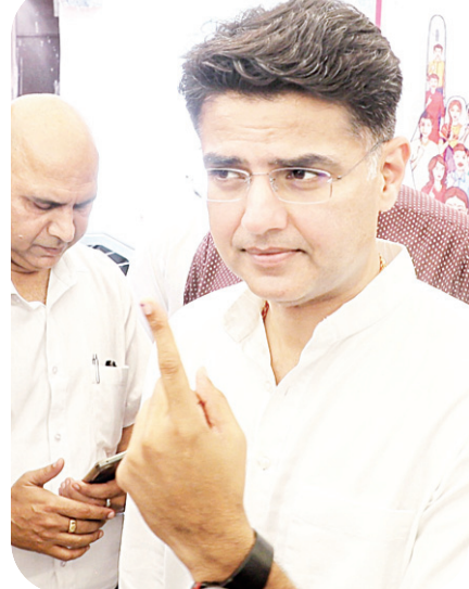
जयपुर के एक बूथ में कांग्रेस के वरिष्ठ नेता सचिन पायलट ने वोट डाला।