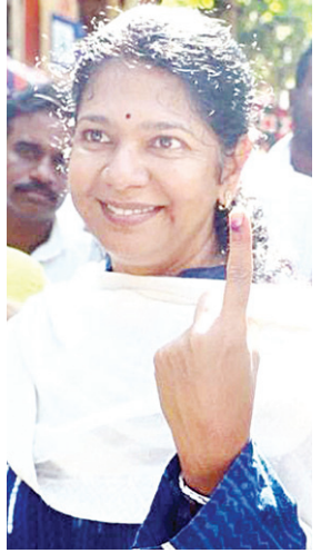
डीएमके नेता कनिमोड़ी ने चेन्नई में वोट डालने के बाद प्रसन्नता व्यक्त की।