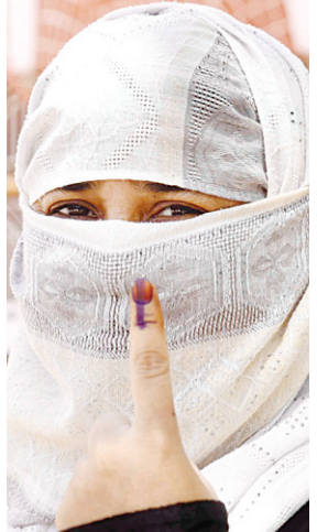
औरंगाबाद: वोट डालने के बाद एक स्याही लगी अपनी उंगली दिखाती युवती।