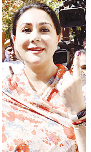
राजस्थान की डिप्टी सीएम दीया कुमारी ने जयपुर के एक बूथ में किया मतदान।