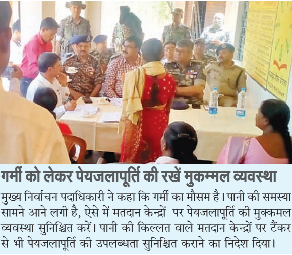
गर्मी को लेकर पेयजलापूर्ति की रखें मुकम्मल व्यवस्था मुख्य निर्वाचन पदाधिकारी ने कहा कि गर्मी का मौसम है। पानी की समस्या सामने आने लगी है, ऐसे में मतदान केंद्रों पर पेयजलापूर्ति की मुकम्मल व्यवस्था सुनिश्चित करें। पानी की किल्लत वाले मतदान केंद्रों पर टैंकर से भी पेयजलापूर्ति की उपलब्धता सुनिश्चित कराने का निर्देश दिया।

नवीन मोल संवाददाता गढ़वा। लोकसभा चुनाव की तैयारियों को अंतिम रूप दिया जा रहा है। तैयारियों में कोई शिथिलता और बहानेबाजी नहीं चलेगी। गर्मी-धूप लग रही, तो माथे पर गमछ लगाएं और क्षेत्र भ्रमण कर निरोधात्मक कार्रवाइयां सुनिश्चित करें। निर्वाचन कार्य की तैयारियों में बेहतर परिणाम चाहिए। यह बातें मुख्य निर्वाचन पदाधिकारी, झारखंड के, रवि कुमार ने कही। वे आज लोकसभा चुनाव 2024 के तहत पलामू लोकसभा क्षेत्र के गढ़वा जिले में अबतक की गई तैयारियों की समीक्षा कर रहे थे। गढ़वा जिले के समाहरणालय सभागार में आयोजित बैठक में मुख्य निर्वाचन पदाधिकारी ने अवैध शराब की बिक्री एवं आवाजाही पर पूर्ण प्रतिबंध लगाने का निर्देश दिया। उन्होंने संपूर्ण जिला क्षेत्र के साथ-साथ बॉर्डर क्षेत्र के प्रखंड