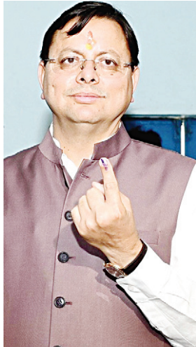
उत्तराखंड के सीएम पुष्कर सिंह धामी और उनके परिजनों ने खटीमा में किया मतदान।

का डूडल एक वैकल्पिक लोगो है। यह सर्च इंजन गूगल के होमपेज पर नजर आता है। गूगल का डूडल अक्सर किसी त्योहार या छुट्टी वाले दिन ही नजर आता है। इसके अलावा गूगल किसी के योगदान को दिखाने के लिए उसके जन्म-दिन और मृत्यु दिवस के दिन यह पेश करता है। उल्लेखनीय है कि देश में 18वीं लोकसभा के लिए चुनाव हो रहे हैं। लोकसभा चुनाव 2024 को सात चरणों में आयोजित किया गया है। इस चुनाव में मतदाता 543 संसदों को अपने मताधिकार के जरिए चुनेंगे। 4 जून, 2024 को चुनावों का परिणाम आएगा।