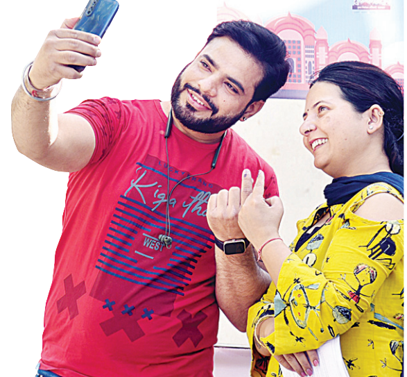
जयपुर के एक मतदान केंद्र पर वोट डालने के बाद स्याही लगी उंगली के साथ सेल्फी लेता एक जोड़ा।