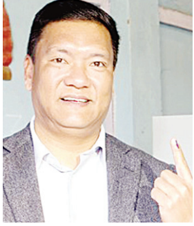
अरुणाचल प्रदेश के मुख्यमंत्री पेमा खांडू ने मतदान के बाद स्याही लगी उंगली दिखाई।