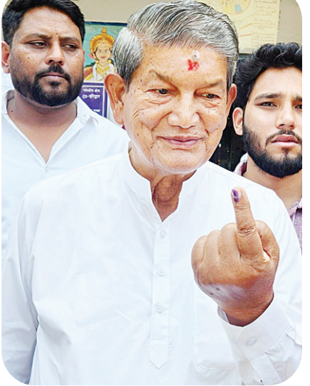
देहरादून के मंडी माजरा के बूथ में कांग्रेसी नेता व पूर्व मुख्यमंत्री हरीश रावत ने मतदान किया।