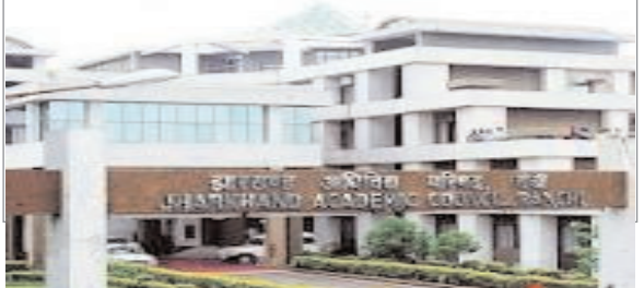
लातेहार से 93.23 प्रतिशत छात्र सफल हुए। वहीं गुमला से 91.866 प्रतिशत परीक्षार्थी सफल हुए हैं। गढ़वा से 91.139 प्रतिशत परीक्षार्थी सफल हुए।