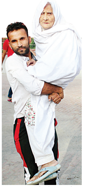
मुजफ्फरनगर में वोट डालने पहुंची एक बुजुर्ग मतदाता की सहायता करता युवक।