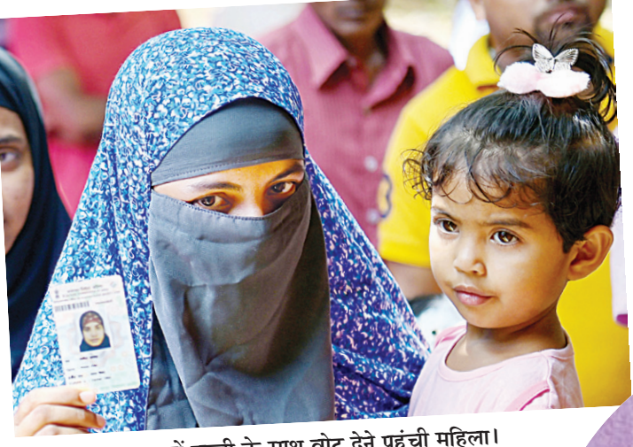
अमरतल्ला में बच्ची के साथ वोट देने पहुंची महिला।