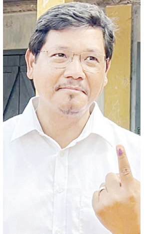
मेघालय के मुख्यमंत्री कॉनराड संगमा ने वेस्ट गारो हिल्स जिले में मतदान किया।