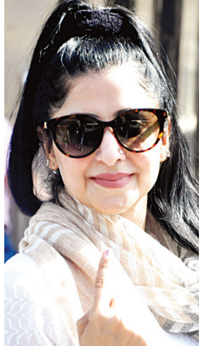
मुरादाबाद के एक मतदान केंद्र पर वोट डालने के बाद प्रसन्न मुद्रा में महिला मतदाता।