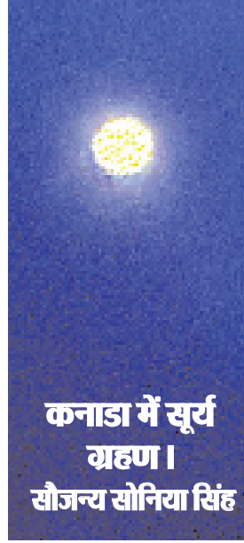
कनाडा में सूर्य ग्रहण।

लाया जाएगा। सुप्रीम कोर्ट ने सुरक्षा के कड़े इंतजाम करने के निर्देश दिए हैं। सुप्रीम कोर्ट ने अपने निर्देश में कहा है कि अब्बास अंसारी को लेकर पुलिस को टीम आज ही शाम पांच बजे से पहले गाजीपुर के लिए रवाना हो जाए। कोर्ट ने 11 अप्रैल और 12 अप्रैल को अब्बास अंसारी को अपने परिवजनों से मिलने की इजाजत दी है। कोर्ट ने अब्बास अंसारी को निर्देश दिया कि इस दौरान वह मीडिया से बात नहीं करेगा। अब्बास अंसारी कासमंज की पचलाना जिला जेल में बंद है और जेल में होने की वजह से वह अपने पिता मुख्तार अंसारी के जनाजे में शामिल नहीं हो सका था। ऐसे में अब्बास अंसारी ने पिता की कब्र पर फातिहा पढ़ने के लिए सुप्रीम कोर्ट में याचिका दायर कर इजाजत मांगी थी।