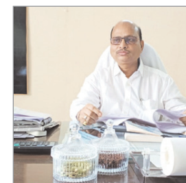
एक सामुदायिक स्वास्थ्य अधिकारी, एएनएम, जीएनएम सहिया, एमपीडब्ल्यू इत्यादि में से कोई एक रहेगा जिनके पास यह दवाइयां होंगी और जो मतदान कर्मी या सुरक्षा कर्मी को इन दवाइयां की आवश्यकता होगी, उन्हें वह तत्काल देगा और उन्हें पानी और दवा खिलाते वक्त भी मौजूद रहेगा। यह दवाइयां जो 12 है

नवीन मेल संवाददाता मेदिनीनगर। आगामी लोकसभा चुनाव के लिए इस बार मेडिकल प्लान में थोड़ा संशोधन किया गया है। 2019 के लोकसभा चुनाव में मतदान कर्मियों और सुरक्षा कर्मियों को 12 दवाइयों की एक गिपर बैग दिया गया था। यह दवाइयां हर एक मतदान केंद्र पर एक स्वास्थ्य कर्मी के पास होगा। यह स्वास्थ्य कर्मी सामुदायिक, स्वास्थ्य अधिकारी, एएनएम, जीएनएम सहिया, एमपीडब्ल्यू इत्यादि में से कोई भी एक हो सकता है। यह सभी स्वास्थ्य कर्मियों और सहिया को इन दवाओं की जानकारी रहती है। पलामू जिले के लोकसभा सीट के लिए 1796 मतदान केंद्र है। इस तरह से हर एक मतदान केंद्र पर