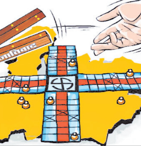
जिसने 2019 के लोकसभा चुनाव में बीजेपी को 2014 चुनाव से भी ज्यादा सीटें दिलाई।

स्तंभों पर मजबूती के साथ टिका है। इन चार जातियों का उत्थान ही भारत को विकसित बनाएगा। गरीब महिला और युवा वोटरों का एक बड़ा वर्ग बीजेपी के साथ मजबूती से खड़ा है