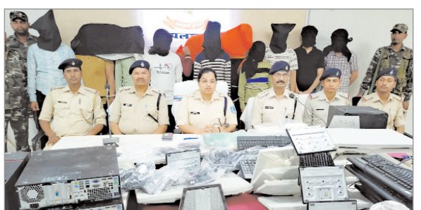
साइबर अपराध का नया अड्डा बना पलामू।

ऑनलाइन जुआ और गेमिंग धंधा के आरोप में 13 साइबर अपराधी गिरफ्तार, रोजाना करोड़ों रुपए का लेन-देन