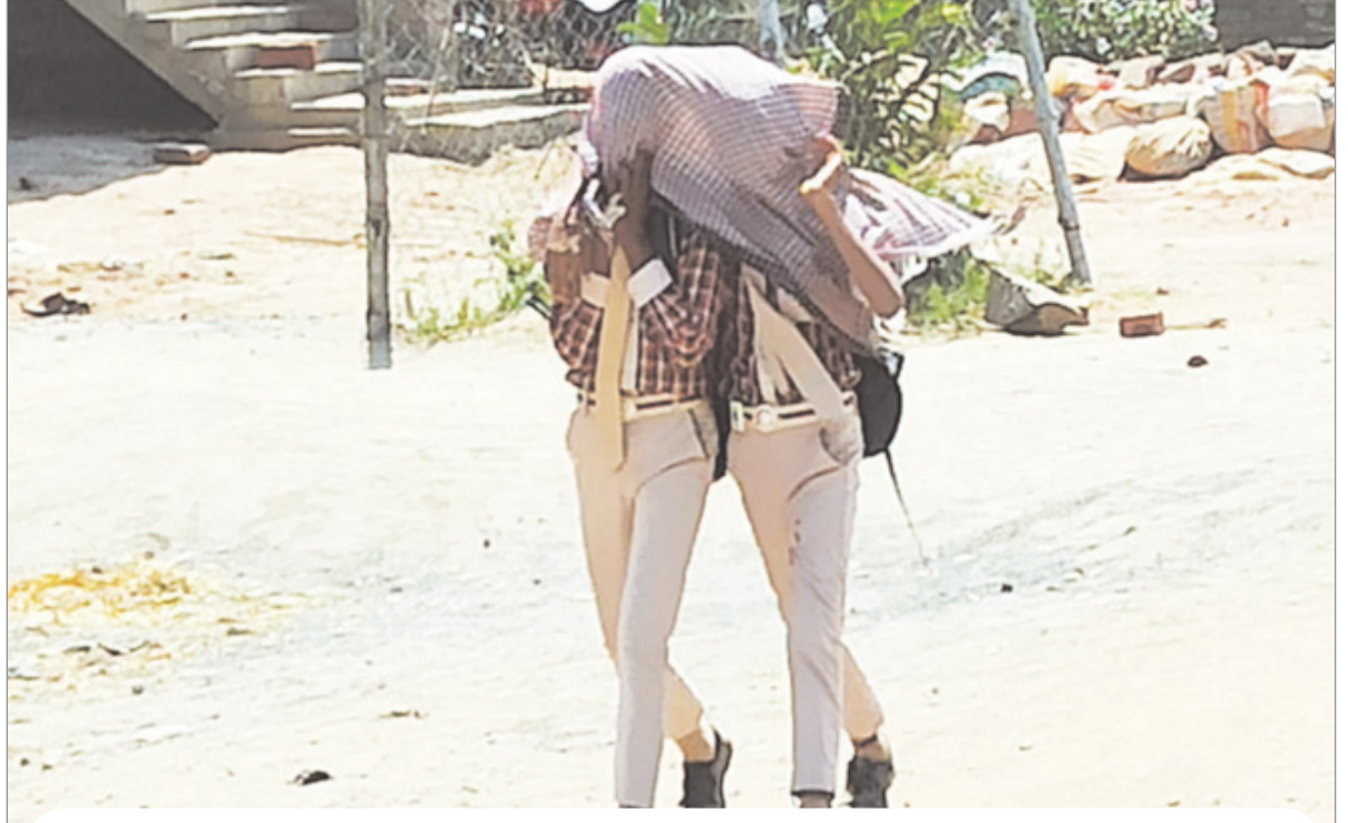
बदलते मौसम की बढ़ती गर्मी से स्कूली बच्चों का हाल-बेहाल ।