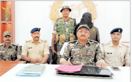
नेशनल गंडू का विभिन्न थानों में 17 अपराधिक मामले दर्ज।

पुलिस छापेमारी में भटका कमांडर आया पुलिस की गिरफ्त में नवीन मेल संवाददाता