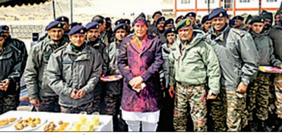
पराक्रम की राजधानी है। राजनाथ सिंह के साथ थल सेनाध्यक्ष जनरल मनेज पांडे और फायर एंड प्युरी कोर के जनरल ऑफिसर कर्माडिंग

एजेंसी। नई दिल्ली। रक्षा मंत्री राजनाथ सिंह ने रविवार को लद्दाख क्षेत्र को देश के शौर्य और पराक्रम की राजधानी करार दिया। राजनाथ सिंह ने रविवार को लेह में जवानों के साथ होली खेली। इस दौरान उन्होंने कहा, "जैसे दिल्ली राष्ट्रीय राजधानी है, मुंबई वित्तीय राजधानी है और बेंगलुरु प्रौद्योगिकी राजधानी है, ऐसे ही लद्दाख भारत की शौर्य और