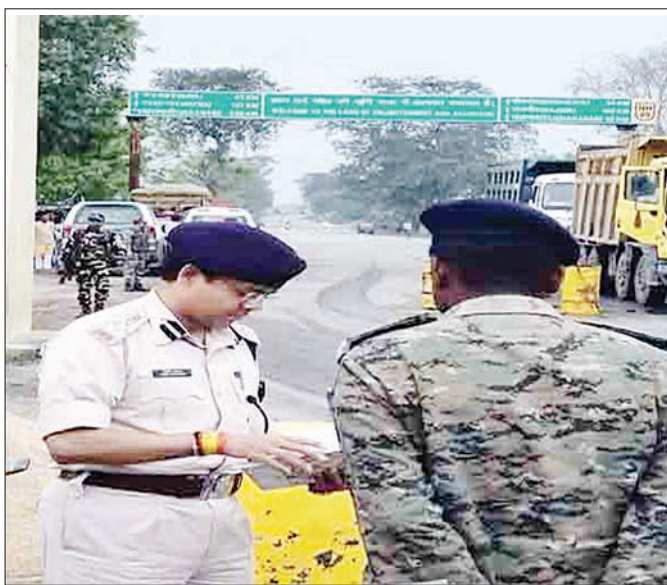
सुरक्षा के व्यापक प्रबंध करने के निर्देश इसके बाद डीआईजी ने चतरा और बिहार-गया जिला के सीमा पर स्थित गोसाइंडीह और हटरगंज चेकपोस्ट का निरीक्षण किया। डीआईजी ने मौके पर मौजूद पुलिसकर्मियों को सुरक्षा के व्यापक प्रबंध करने, तकनीकी तौर पर दक्ष रहने और किसी तरह से भयादोहन न हो, यह सुनिश्चित करने के निर्देश दिए।