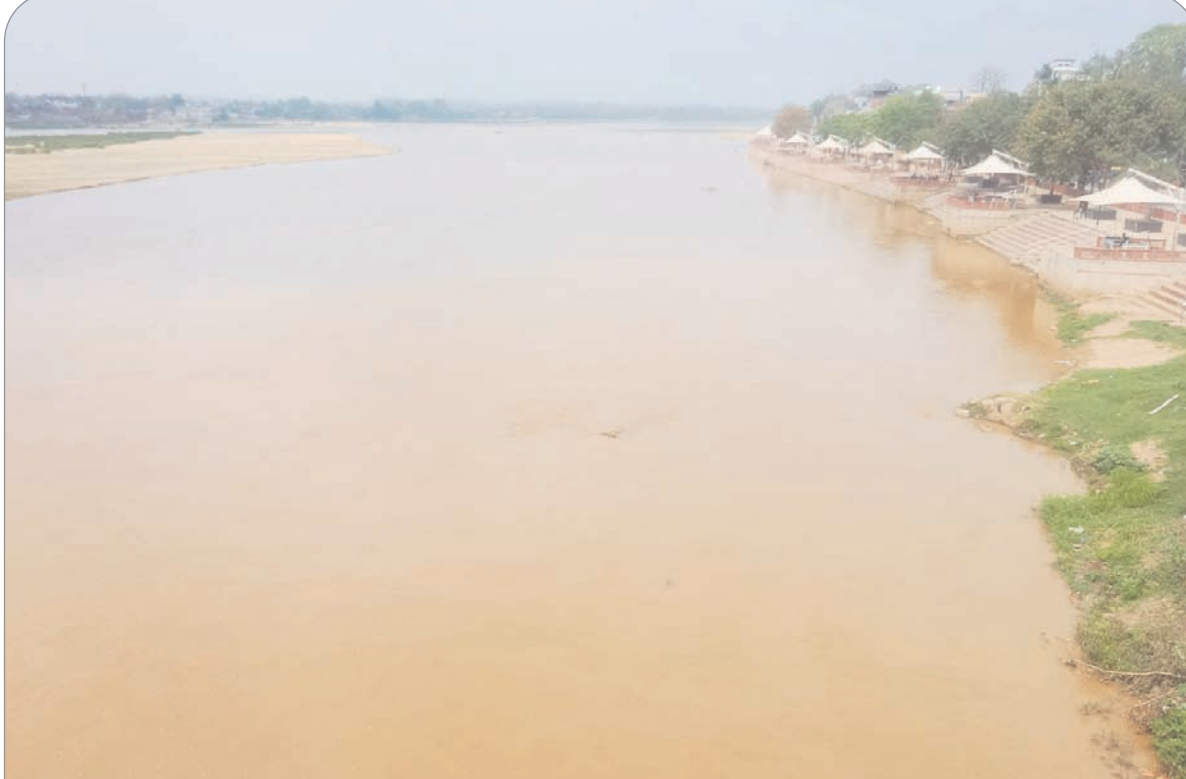
पलामू से सटे विभिन्न जिले में हुई वे मौसम बरसात से कोयल में दिख रहा पानी संजीवनी प्रतीत हो रही है।

पहुंचकर जानकारी हासिल की। पीड़िता की शिकायत पर शहर थाने में मारपीट से संबंधित मामला दर्ज कर पुलिस मामले की छानबीन में जुट गई है।