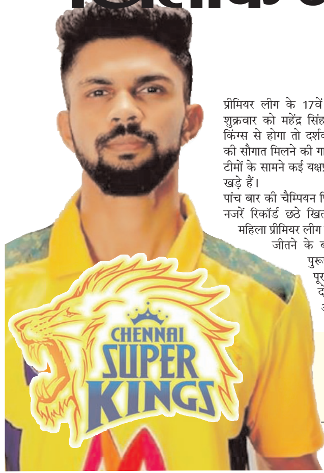
एजेंसी। चेन्नई स्टार बल्लेबाज विराट कोहली की मौजूदगी वाली रॉयल चैलेंजर्स बेंगलोर का सामना इंडियन

प्रिमियर लीग के 17वें सत्र के पहले मैच में शुक्रवार को महेंद्र सिंह धोनी की चेन्नई सुपर किंग्स से होगा तो दर्शकों को रोमांचक क्रिकेट की सौगात मिलने की गारंटी रहेगी हालांकि दोनों टीमों के सामने कई यशप्रश्न टूर्नामेंट से पहले ही खड़े हैं।