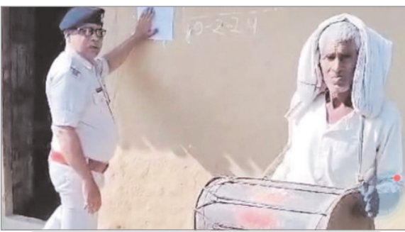
थाना प्रभारी ने कहा कि अभिव्यक्तियों के खिलाफ न्यायालय की यह तीसरी बड़ी कार्रवाई है। इसके बाद भी अभियुक्त गण न्यायालय में अगर सशरीर हाजिर नहीं होते हैं तो उनके खिलाफ कुर्की जन्बी की अंतिम कार्रवाई शुरू हो जाएगी।