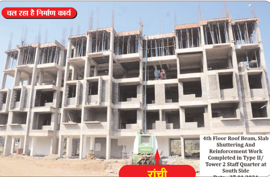
चल रहा है निर्माण कार्य