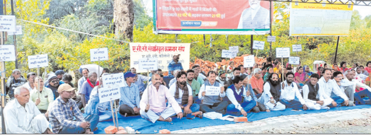
एसीसी सेवानिवृत्त कामगार संघ ने खलारी अंचल कार्यालय के समक्ष दिया धरना