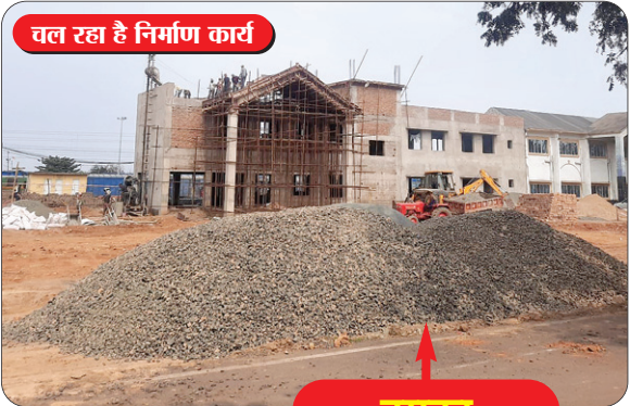
चल रहा है निर्माण कार्य

में 80 रेलवे स्टेशन हैं। भारत की जीवनरेखा कही जाने वाली, भारतीय रेल प्रतिदिन 13,000 ट्रेनों का संचालन करती है, जो पूरे देश में 7,325 स्टेशनों को जोड़ती है। रेल विभाग हाल के वर्षों में पूंजीगत व्यय में अभूतपूर्व वृद्धि का गवाह रहा है और वित्तीय वर्ष 2024-25 के दौरान पूंजीगत व्यय के लिए 2.52 लाख करोड़ रुपये निर्धारित किए गए हैं।