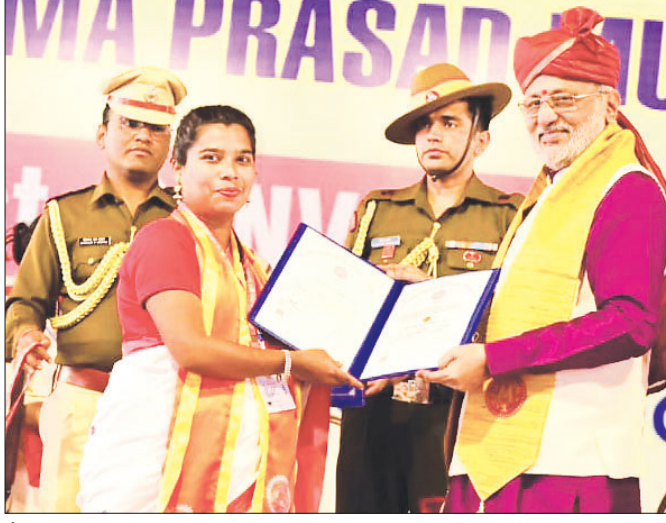
विवि के 198 टॉपरों को मिला गोल्ड मेडल

नवीन मेल संवाददाता। रांची राज्यपाल सीपी राधाकृष्णन ने कहा कि हमारे देश के युवाओं ने ही भारत की विकास गाथा रची है। आज दुनिया हमारे देश को एक उभरती हुई महाशक्ति के रूप में देखती है। हमारा देश सक्रिय रूप से 2047 तक "विकसित भारत" की दिशा में आगे बढ़ रहा है। इस यात्रा में हममें से प्रत्येक को महत्वपूर्ण भूमिका निभानी है। राज्यपाल गुरुवार को डॉ. श्यामा प्रसाद मुखर्जी विश्वविद्यालय के प्रथम दीक्षांत समारोह में बतौर मुख्य अतिथि बोल रहे थे। राज्यपाल ने कहा कि शिक्षा का अर्थ केवल व्यक्तिगत लाभ नहीं है, बल्कि समाज की भलाई में योगदान देना भी है। क्या आपने सोचा है कि आप कैसे बदलाव ला सकते हैं? कृपा अपनी सभी गतिविधियों में नैतिकता और सामाजिक जिम्मेदारी के महत्व पर विचार करें। उन्होंने कहा कि अपने समुदाय और समाज पर सकारात्मक प्रभाव डालने के लिए अपनी शिक्षा और कौशल का उपयोग करें। समाज के आर्थिक रूप से कमजोर वर्ग के छात्रों तक अपनी मदद पहुंचाएं और उन्हें बेहतर शिक्षा के अवसर उपलब्ध कराने में मदद करें। आपकी उपलब्धियों से न केवल आपको लाभ होना चाहिए बल्कि आपके आस-पास के लोगों का भी उत्थान होना चाहिए। जैसे ही आप अपने जीवन के इस नए चरण की शुरुआत करते हैं। दूरदर्शी नेता, एक प्रख्यात राजनीतिज्ञ और आधुनिक भारत का आकार देने में महत्वपूर्ण भूमिका निभाने वाले प्रतिष्ठित शिक्षाविद् डॉ. श्यामा प्रसाद मुखर्जी के शब्दों को याद रखें। शिक्षा किसी के व्यक्तिगत विकास है और