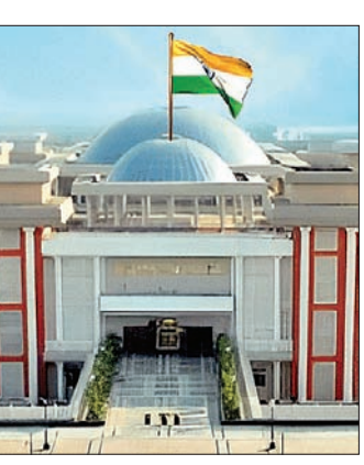
नवीन मेल संवाददाता। रांची झारखंड हाई कोर्ट में झारखंड स्टाफ सेलैक्शन कमीशन (जेएसएससी) की ओर से कंबाईंड ग्रेजुएट लेवल एजाम (सीजीएल) की 28 जनवरी को आयोजित परीक्षा के पेपर लीक मामले में जेएसएससी की ओर से परीक्षा का आयोजन करने वाली एजेंसी को ब्लैकलिस्टेड किए जाने को लेकर दिए गए शोर्काज के खिलाफ दायर याचिका की सुनवाई गुरुवार को हुई। मामले में कोर्ट ने परीक्षा आयोजित करने वाली सतवत इंफोसोल प्राइवेट लिमिटेड को अंतरिम राहत