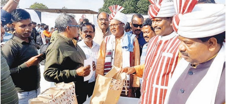
खादी को वैश्विक मंच पर मिली पहचान अर्जुन मुंडा ने कहा कि प्रधामंत्री नरेंद्र मोदी के नेतृत्व में वोक्ल फॉर लोकल और मेक इन इंडिया मंत्र ने खादी को सरकार के ग्रामोद्योग विकास योजना के अंतर्गत ग्रामीण कारीगरों को एक करोड़ 47 लाख की मशीनों और टूलकिट वितरण समारोह को संबोधित कर रहे थे।

नवीन मेल संवाददाता। रांची/खूंटी केन्द्र की मोदी सरकार पिछले नौ साल से देश के हर परिवार को सुखी करने के प्रयास में लगी है। खासकर किसानों की आय दुगुनी करने के लिए काफी प्रयास किये जा रहे हैं। खादी ग्रामोद्योग से जुड़कर जुड़कर महिलाएं और पुरुष आत्मनिर्भर बनते जा रहे हैं। विश्वकर्मा योजना के तहत पारम्परिक पारिवारिक कार्यों से जुड़े परिवार को तकनीकी रूप से विकसित करने का प्रयास लगातार केन्द्र सरकार द्वारा किया जा रहा है। ये बातें केंद्रीय कृषि एवं किसान कल्याण मंत्री अर्जुन मुंडा ने कही। वह कृषि विज्ञान केंद्र में गुरुवार को आयोजित खादी और ग्रामोद्योग आयोग (केबीआईसी), सूक्ष्म, लघु एवं मध्यम, उद्यम मंत्रालय, भारत सरकार के ग्रामोद्योग विकास योजना के अंतर्गत ग्रामीण कारीगरों को एक करोड़ 47 लाख की मशीनों और टूलकिट वितरण समारोह को संबोधित कर रहे थे।