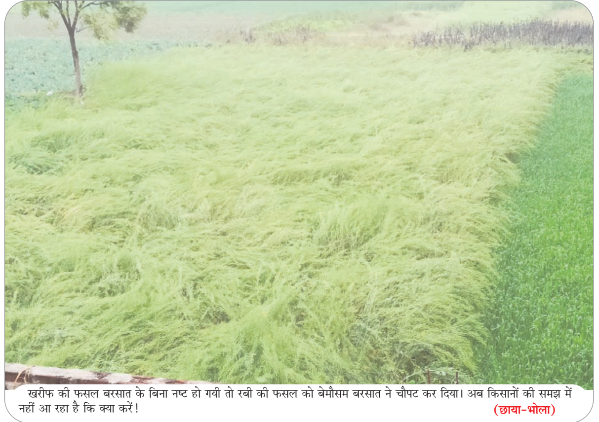
खरीफ की फसल बरसात के बिना नष्ट हो गयी तो रबी की फसल को बेमौसम बरसात ने चौपट कर दिया। अब किसानों की समझ में नहीं आ रहा है कि क्या करें!

तड़क-गरज के साथ गिरे ठनके, किसानों के उड़े होश मेदिनीनगर। जिला मुख्यालय मेदिनीनगर व आसपास के क्षेत्रों में गुरुवार शाम अचानक भारी तड़क-गरज के साथ ठनके गिरने से किसानों के होश उड़ गये हैं। रबी की फसलों के लिये ठनके व बरसात वर्तमान में किसी बड़ी आफत से कम नहीं है। चार दिन पूर्व जिले के सुदूर अंचलों में आंधी-पानी व ओले पड़ने से फसलों को पहुंची भारी क्षति की मार से किसान अभी संभले भी नहीं थे कि दोबारा हुई आफत की बारिश ने उनकी कमर तोड़ दी है। बेमौसम बरसात के कारण सरसों, अरहर, मसूर, मटर सहित गेहूँ की फसलों को भी व्यापक नुकसान पहुंचा है।