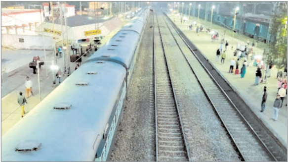
जंक्शन के मध्य अंडरपासों का निर्माण पूर्ण हो चुका है। 26